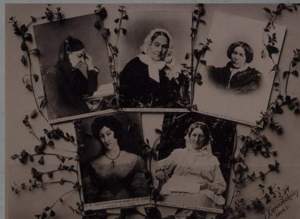
Мать и сёстры Николая