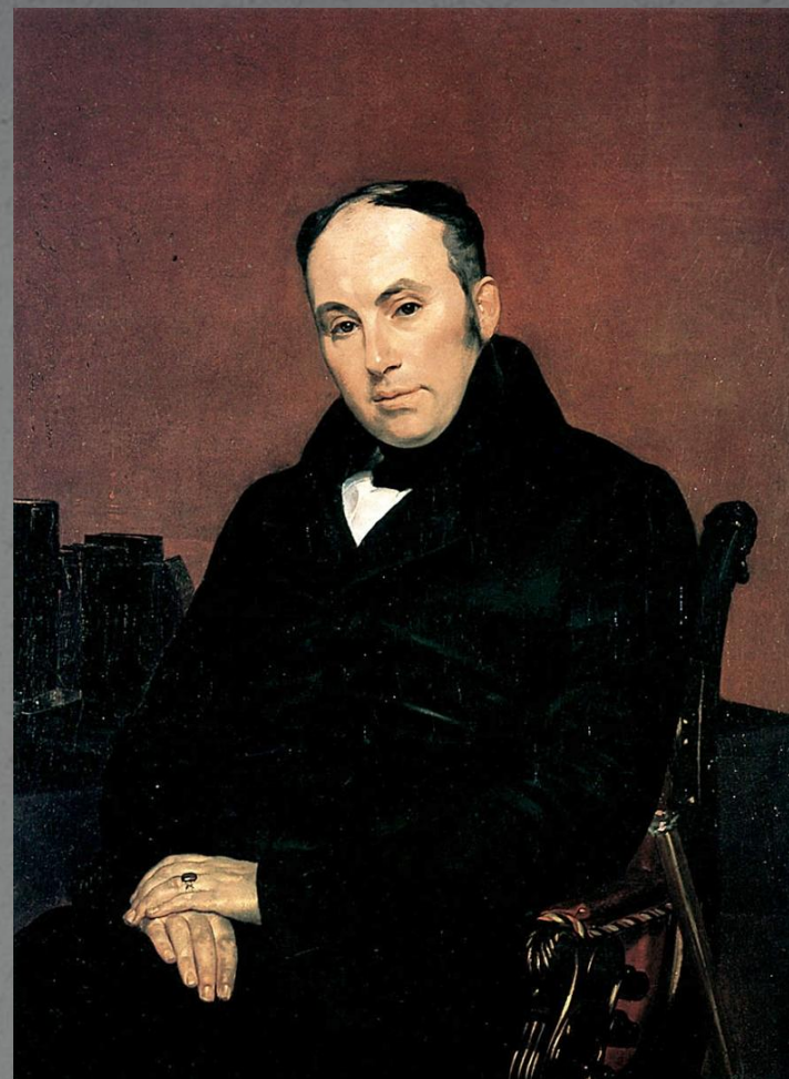
Василий Андреевич Жуковский