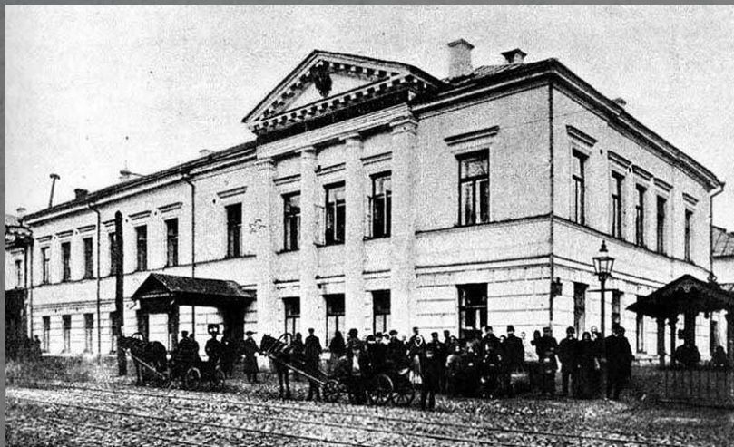
Полтавское уездное училище