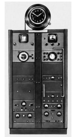
Квантовые (атомные) часы