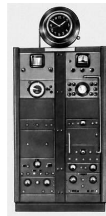
Квантовые (атомные) часы