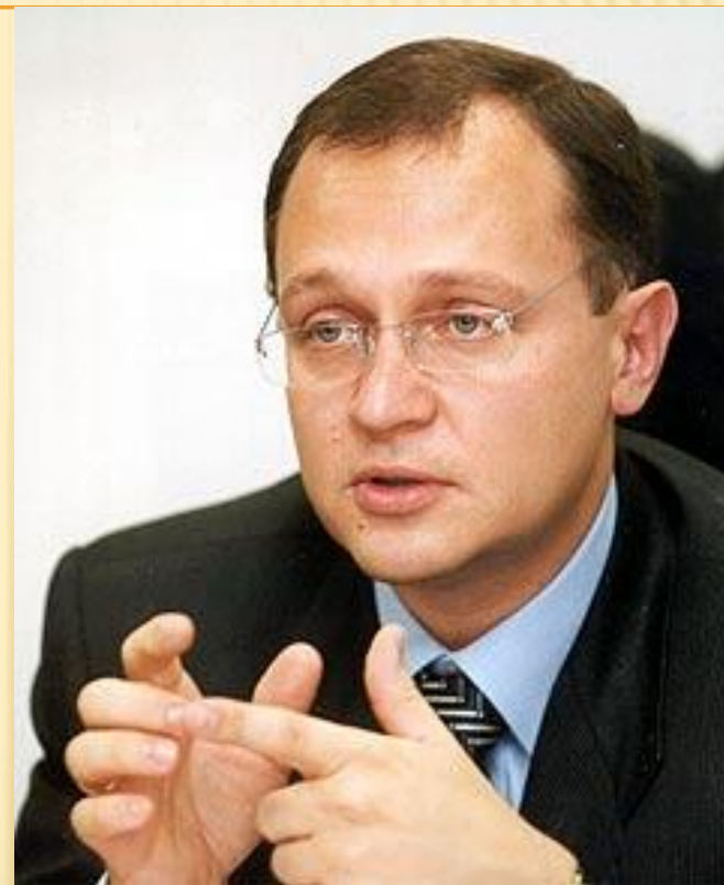
Сергей Владиленович Кириенко, Премьер-министр

Курс рубля к доллару к осени 1998 г. снизился в четыре раза.