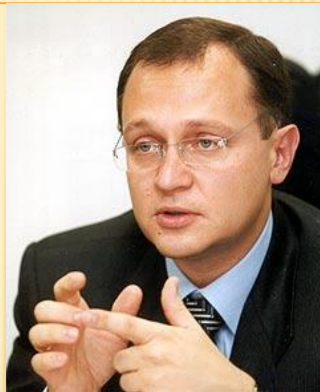
Сергей Владименович Кириенко, Премьер-министр

Курс рубля к доллару к осени 1998 г. снизился в четыре раза.