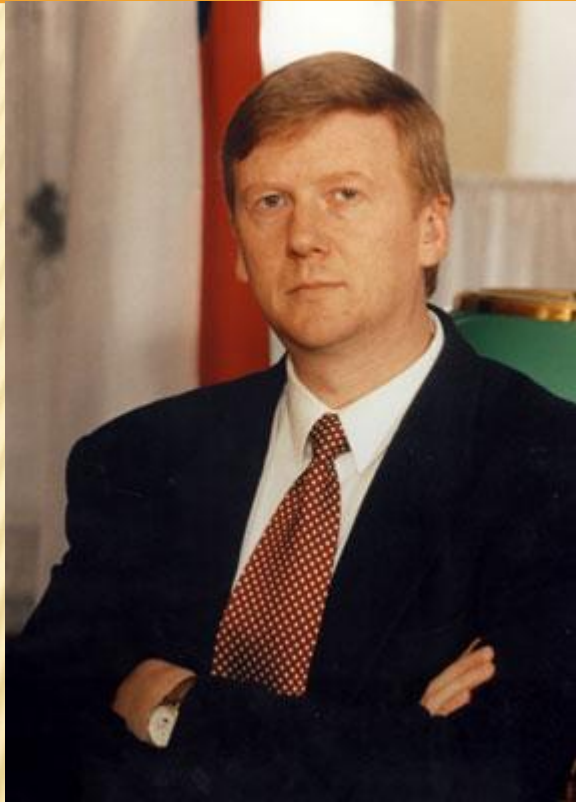
Анатолий Борисович Чубайс

Формирование слоя собственников – важная задача экономической реформы