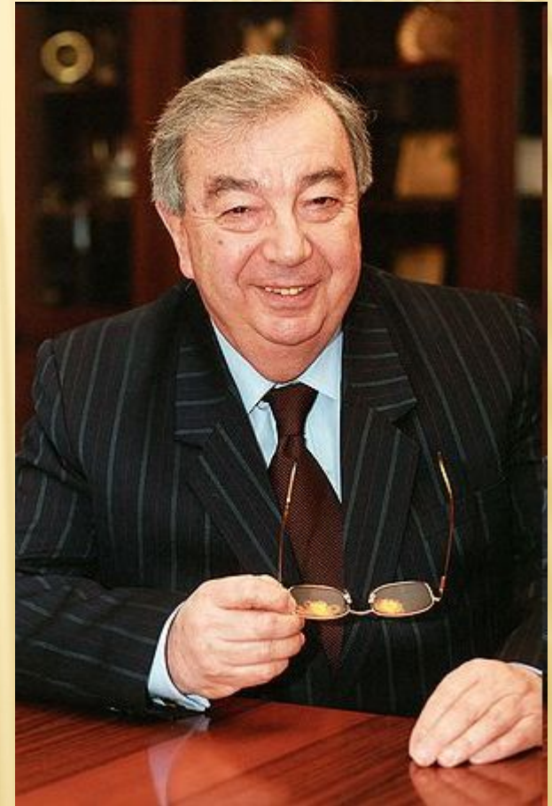
Евгений Максимович Примаков, Премьер-министр

Удалось вдвое снизить государственные расходы и выйти в профицит бюджета