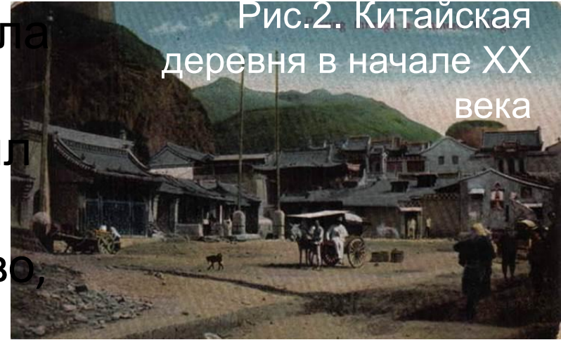
Рис.2. Китайская деревня в начале XX века

В 1911-1913 году в Китае проходила т.н. «Синьхайская революция». К началу XX века Китай представлял собой полуразвалившееся отсталое феодальное государство, которое было неспособно противостоять внешним и