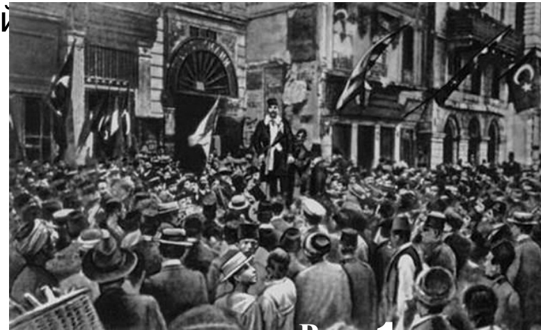
Рис. 1 Младотурки

В 1905 г. – в Китае, в 1905-1911 гг. – в Японии, в 1905-1911 гг. – в Индии, в 1905-1911 гг. – в Персии, в 1905-1911 гг. – в Турции, в 1911-1913 гг. – в Китае. На протяжении первого десятилетия XX века национально-освободительное движение прокатилось по Индии и другим колониям Азии.