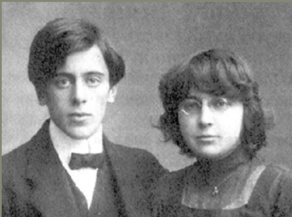
С. Эфрон, М. Цветаева.

Одна, ни в чем не схожая, Несхожеством горда, Дорогою прохожею Не шла ты никогда.