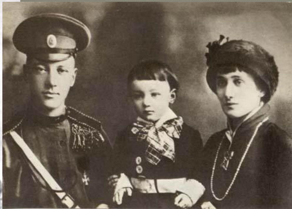
Н. Гумилев, сын Лев, жена – А. Ахматова.