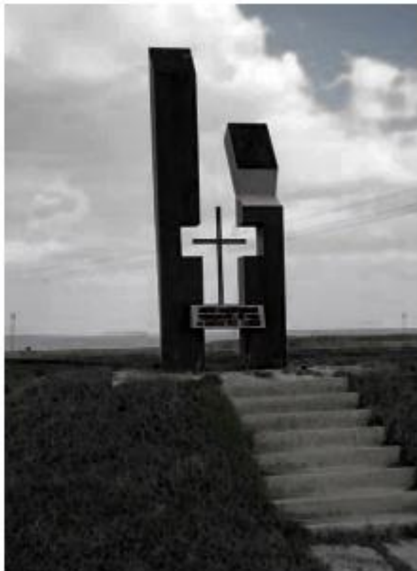
А.Л.Ж.И.Р. - Акмолинский лагерь жен изменников Родины