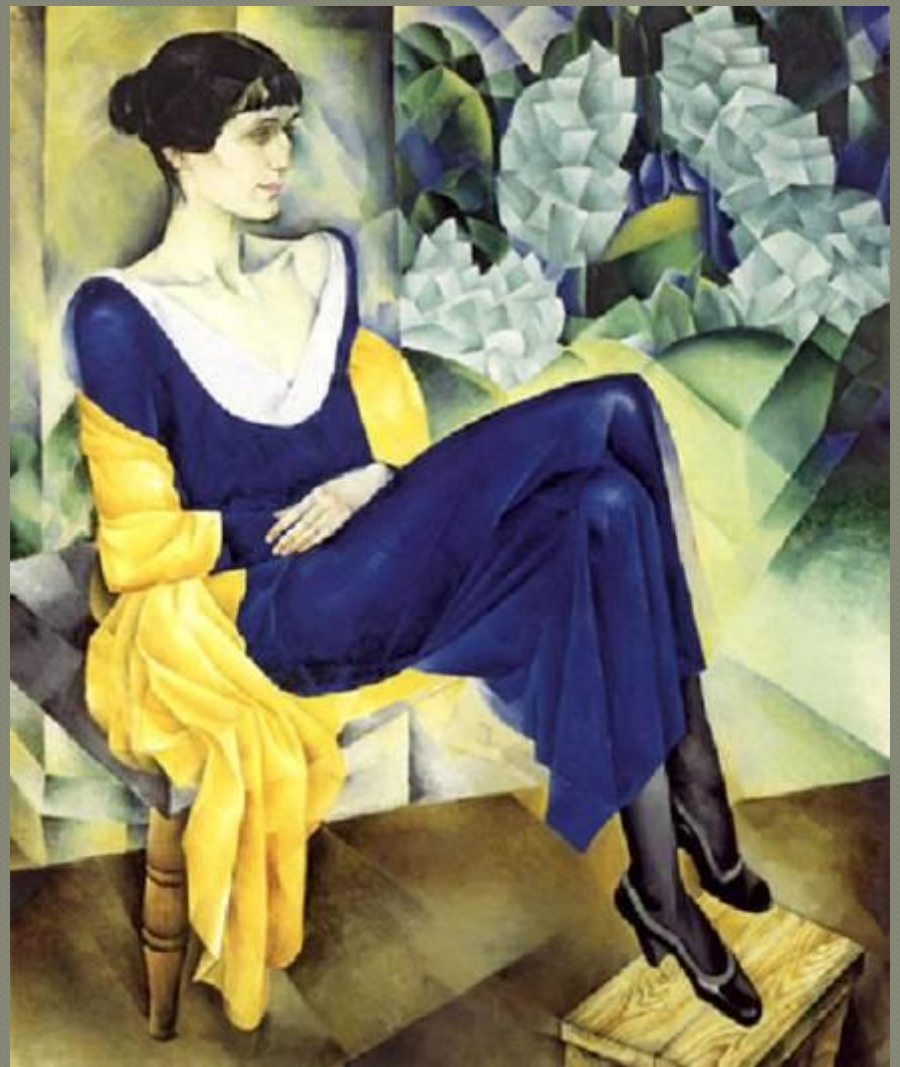
Н. Альтман. Портрет А. Ахматовой.

«Я была тогда с моим народом, Там, где мой народ, к несчастью, был»