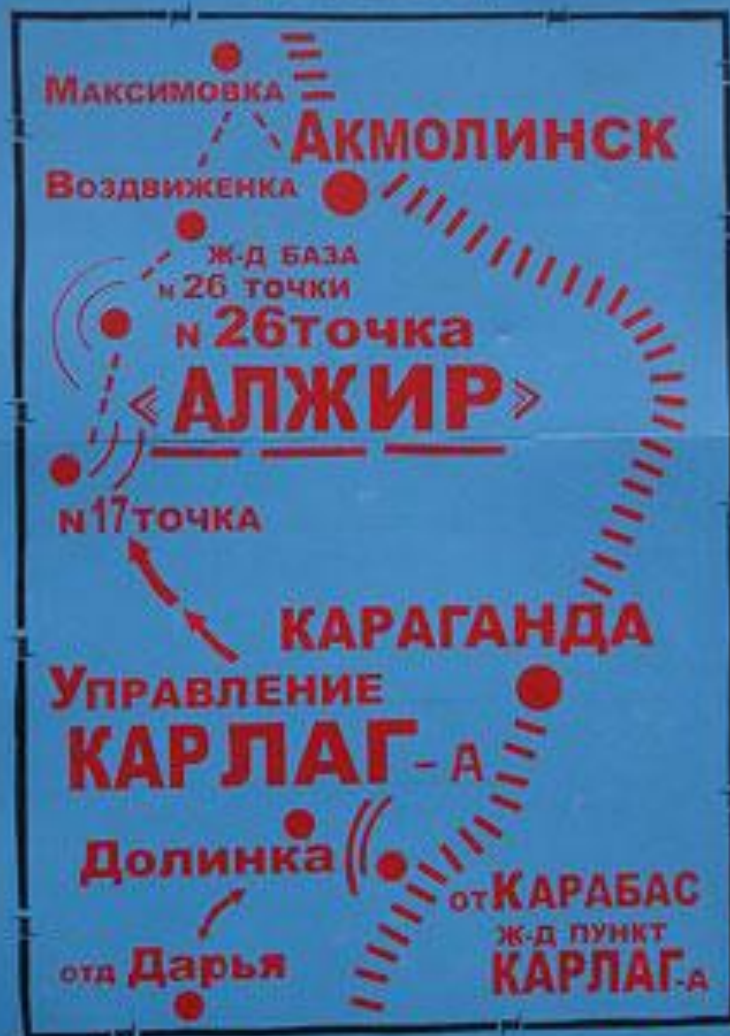
СХЕМА РАСПОЛОЖЕНИЯ АЛЖИР-а В СИСТЕМЕ КАРЛАГ-а (1930-1950 г.г)