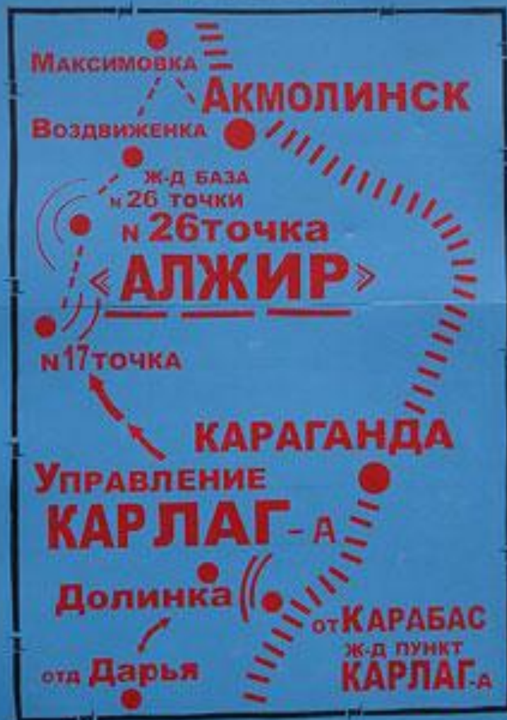
СХЕМА РАСПОЛОЖЕНИЯ АЛЖИР-а В СИСТЕМЕ КАРЛАГ-а (1930-1950 гг)