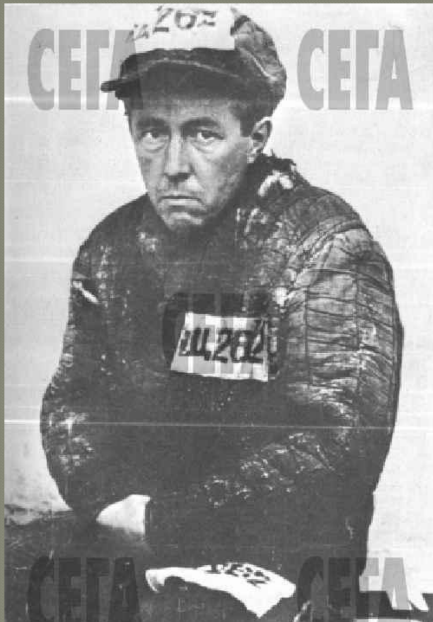
Особлаг (сразу после выхода 1953 г.)