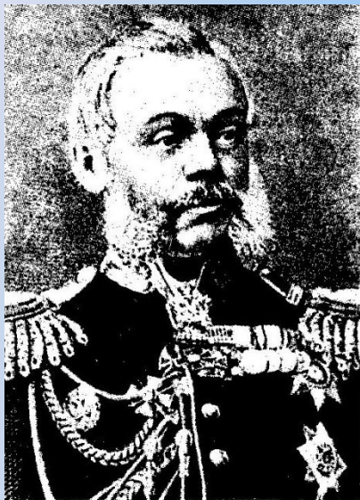
Дмитрий Алексеевич Милютин

Всеобщая воинская повинность для мужчин с 20 лет. Срок службы зависел от уровня образования призывника. Перевооружение армии. Новые военные учебные заведения.