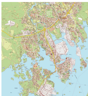
Городские вело- и пешеходные маршруты и карты