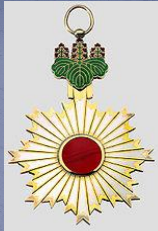
Японский орден Восходящего Солнца

В 1907 году Руднев был награждён японским орденом Восходящего солнца II степени.