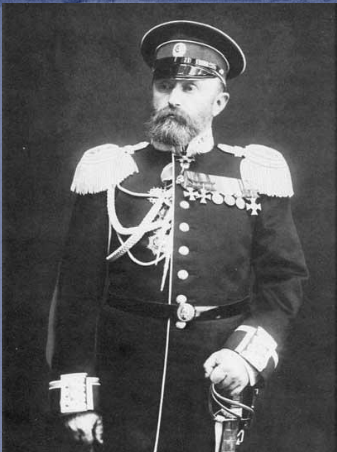
Контр-адмирал В.Ф. Руднов