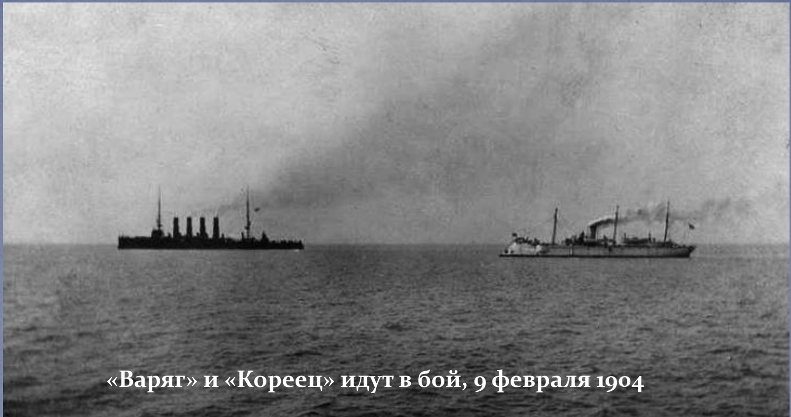
«Варяг» и «Кореец» идут в бой, 9 февраля 1904

В первый день русско-японской войны «Варяг» и канонерская лодка «Кореец» были заблокированы в Чемульпо (Корея). При попытке прорвать блокаду они были вынуждены маневрировать в узком и мелководном фарватере, ведя бой с шестью японскими крейсерами.