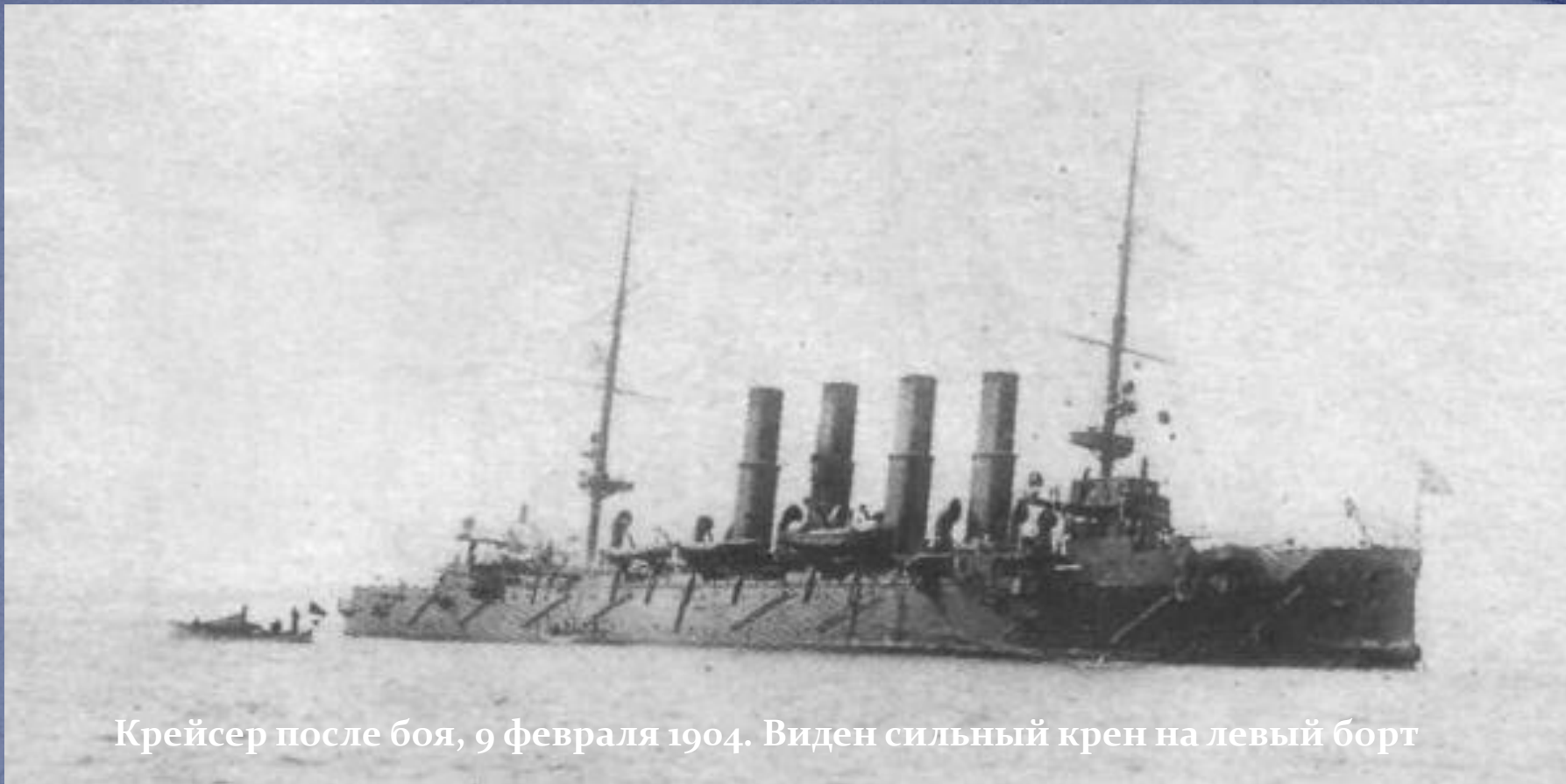
Крейсер после боя, 9 февраля 1904. Виден сильный крен на левый борт

Из-за полученных тяжёлых повреждений «Варяга», русские корабли вернулись на рейд в Чемульпо. «Кореец» был взорван, «Варяг» затоплен