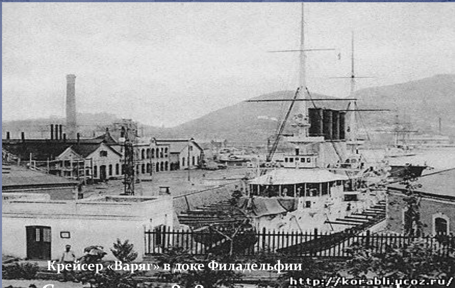
Крейсер «Варяг» в доке Филадельфии