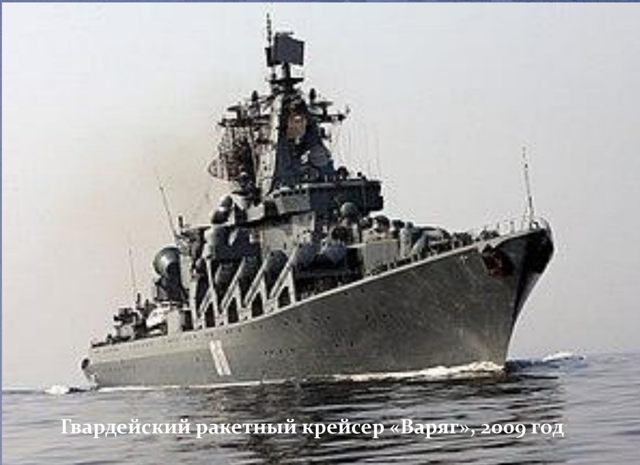
Гвардейский ракетный крейсер «Варяг», 2009 год

19 апреля 1990 года «Варяг» был разоружен, исключён из состава Военно-морского флота и 21 мая 1991 года расформирован. Почётное имя «Варяг» было передано авианесущему крейсеру