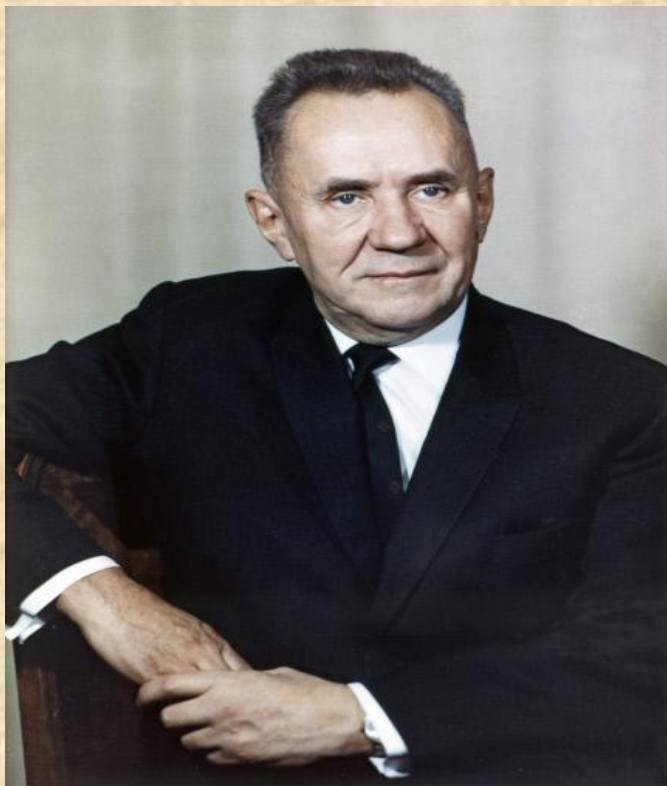
Косыгин Алексей Николаевич Председатель Совета Министров (1964—1980 гг.)

Цель: стимулировать материальный интерес, который бы привел к повышению общественного производства.