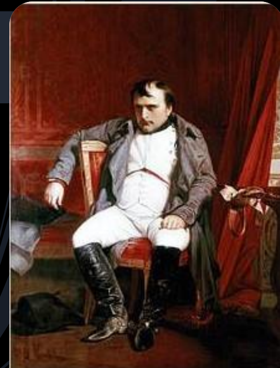
Наполеон Бонапарт после отречения во дворце Фонтенбло Поль Деларош

Союзники Наполеона, принявшие континентальную блокаду вопреки своим интересам, не стремились строго её соблюдать. Росла напряжённость между ними и Францией. Всё более очевидными становились противоречия между Францией и Россией. Патриотические движения ширились в Германии, в Испании не угасала герилья. Разорвав отношения с Александром I, Наполеон решился на войну с Россией. Русская кампания 1812 стала началом конца Империи. Огромная разноплеменная армия Наполеона не несла в себе прежнего революционного духа, вдали от родины на полях России она быстро таяла и наконец перестала существовать. По мере движения русской армии на запад антинаполеоновская коалиция росла. Против наспех собранной новой французской армии в «Битве народов» под Лейпцигом выступили русские, австрийские, прусские и шведские войска (16 — 19 октября 1813). Наполеон потерпел поражение и после вступления союзников в Париж отрёкся от престола. В ночь с 12 на 13 апреля 1814 года в Фонтенбло, переживая поражение, оставленный своим двором (рядом с ним были только несколько слуг, врач и генерал Коленкур), Наполеон решил покончить с собой. Он принял яд, который всегда носил при себе после битвы под Малоярославцем, когда только чудом не попал в плен. Но яд разложился от долгого хранения, Наполеон выжил. По решению союзных монархов он получил во владение маленький островок Эльба в Средиземном море. 20 апреля 1814 года Наполеон покинул Фонтенбло и отправился в ссылку.