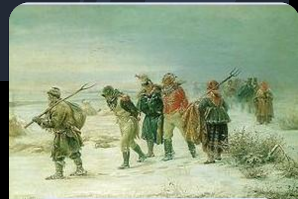
Французы в 1812 г., пленённые партизанами (И. М. Прянишников)

Россия имела большую армию (см. Русская армия 1812 года), но не могла быстро мобилизовать войска из-за плохих дорог и обширной территории. Удар армии Наполеона приняли на себя войска, размещённые на западной границе: 1-я армия Барклая и 2-я армия Багратиона, всего 153 тысячи солдат и 758 орудий[9]. Ещё южнее на Волыни (северо-запад Украины) располагалась 3-я армия Торماسова (до 45 тыс., 168 орудий), служившая заслоном от Австрии. В Молдавии против Турции стояла Дунайская армия Чичагова (55 тыс., 202 орудия). В Финляндии против Швеции стоял корпус русского генерала Штейнгеля (19 тыс., 102 орудия). В районе Риги находился отдельный корпус Эссена (до 18 тыс.), до 4-х резервных корпусов размещались подальше от границы