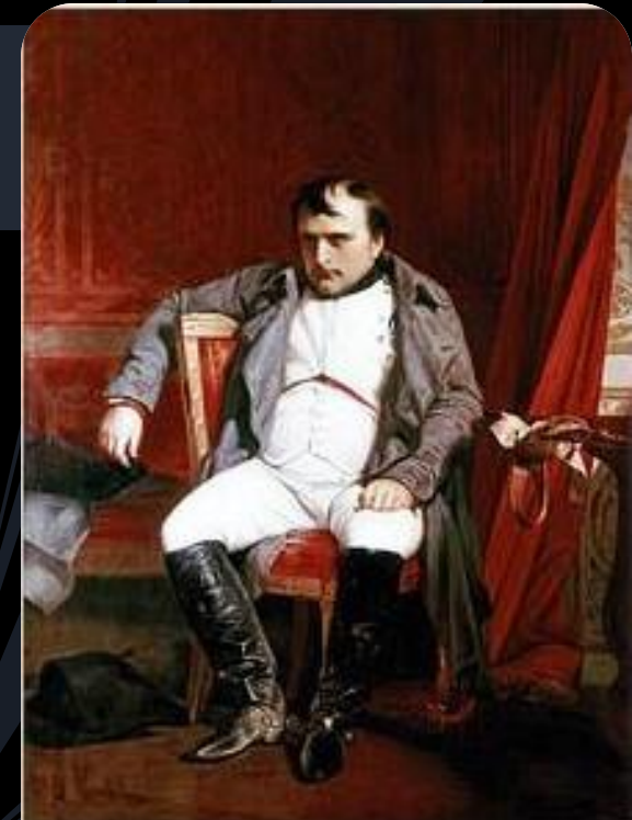
Наполеон Бонапарт после отречения во дворце Фонтенбло Поль Деларош

Союзники Наполеона, принявшие континентальную блокаду вопреки своим интересам, не стремились строго её соблюдать. Росла напряжённость между ними и Францией. Всё более очевидными становились противоречия между Францией и Россией. Патриотические движения ширились в Германии, в Испании не угасала герилья. Разорвав отношения с Александром I, Наполеон решился на войну с Россией. Русская кампания 1812 стала началом конца Империи. Огромная разноплеменная армия Наполеона не несла в себе прежнего революционного духа, вдали от родины на полях России она быстро таяла и наконец перестала существовать. По мере движения русской армии на запад антинаполеоновская коалиция росла. Против наспех собранной новой французской армии в «Битве народов» под Лейпцигом выступили русские, австрийские, прусские и шведские войска (16 — 19 октября 1813). Наполеон потерпел поражение и после вступления союзников в Париж отрёкся от престола. В ночь с 12 на 13 апреля 1814 года в Фонтенбло, переживая поражение, оставленный своим двором (рядом с ним были только несколько слуг, врач и генерал Коленкур), Наполеон решил покончить с собой. Он принял яд, который всегда носил при себе после битвы под Малоярославцем, когда только чудом не попал в плен. Но яд разложился от долгого хранения, Наполеон выжил. По решению союзных монархов он получил во владение маленький островок Эльба в Средиземном море. 20 апреля 1814 года Наполеон покинул Фонтенбло и отправился в ссылку.