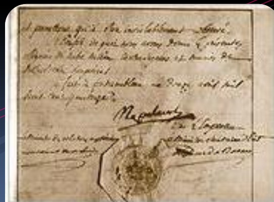
Первый акт отречения от престола, 12 апреля 1814 года