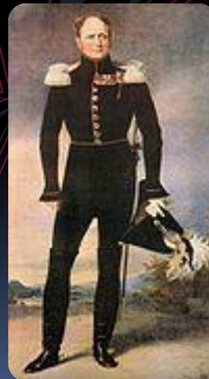
Француз в 1812 г., пленённый партизанами