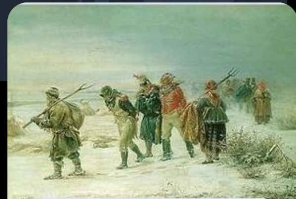
Французы в 1812 г., пленённые партизанами (И. М. Прянишников)

Россия имела большую армию (см. Русская армия 1812 года), но не могла быстро мобилизовать войска из-за плохих дорог и обширной территории. Удар армии Наполеона приняли на себя войска, размещённые на западной границе: 1-я армия Барклая и 2-я армия Багратиона, всего 153 тысячи солдат и 758 орудий[9]. Ещё южнее на Волыни (северо-запад Украины) располагалась 3-я армия Торماسова (до 45 тыс., 168 орудий), служившая заслоном от Австрии. В Молдавии против Турции стояла Дунайская армия Чичагова (55 тыс., 202 орудия). В Финляндии против Швеции стоял корпус русского генерала Штейнгеля (19 тыс., 102 орудия). В районе Риги находился отдельный корпус Эссена (до 18 тыс.), до 4-х резервных корпусов размещались подальше от границы