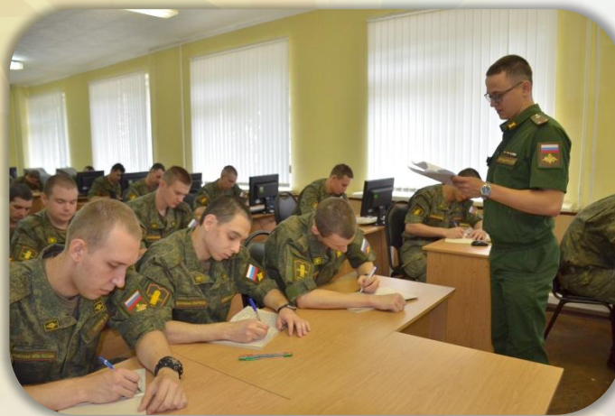
Занятие по военно-политической подготовке