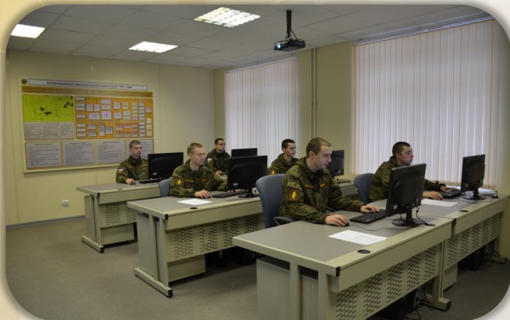
Класс проектирования обучающих систем