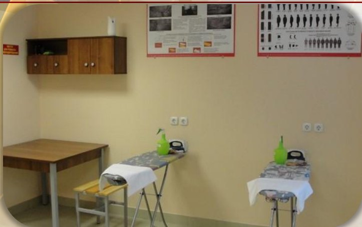
Комната бытового обслуживания