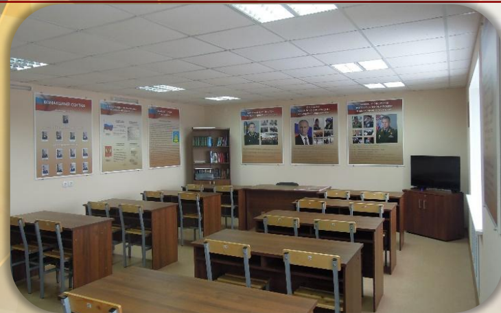
Комната информирования и досуга