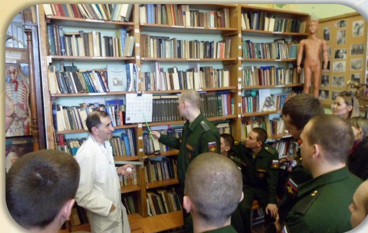
Поход в музей