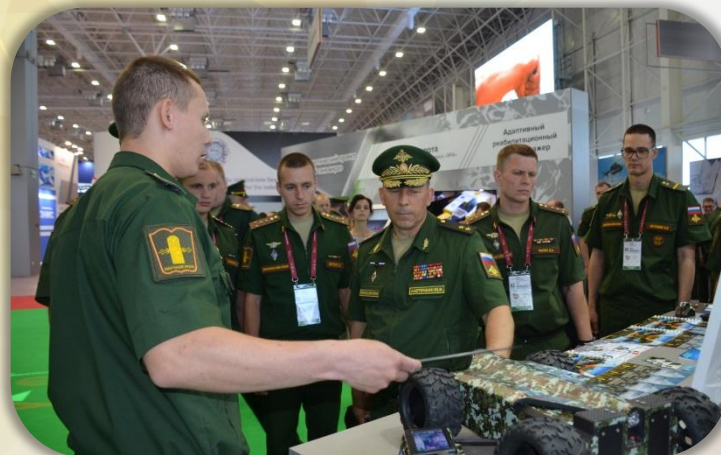
Представление экспонатов начальнику Войск РЭБ ВС РФ