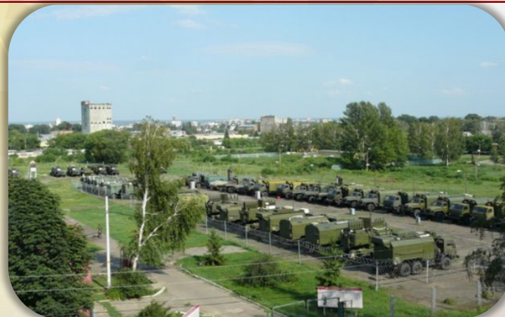
Полевой класс специальной техники РЭБ