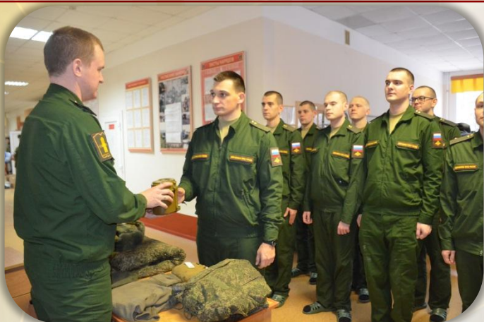
Получение вещевого имущества