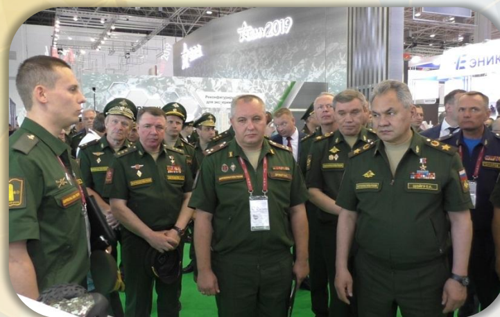
Представление экспонатов Министру обороны Российской Федерации