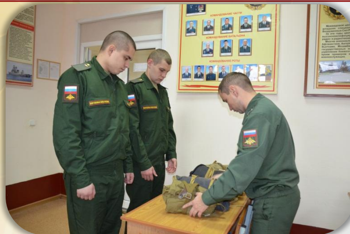
Обеспечение средствами индивидуальной защиты