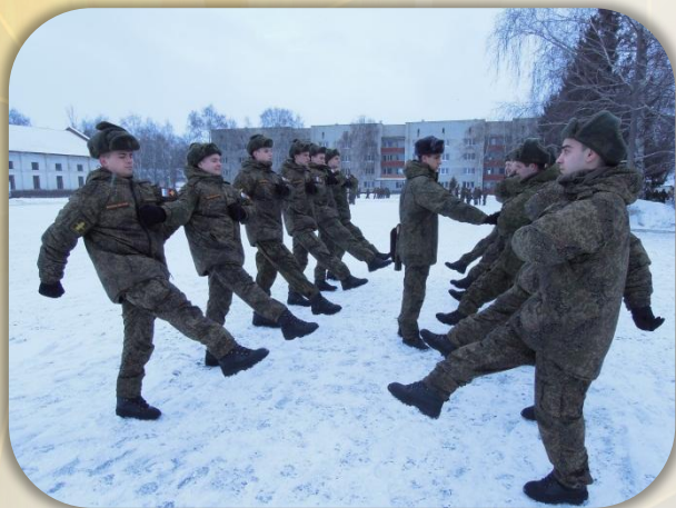
Занятие по строевой подготовке