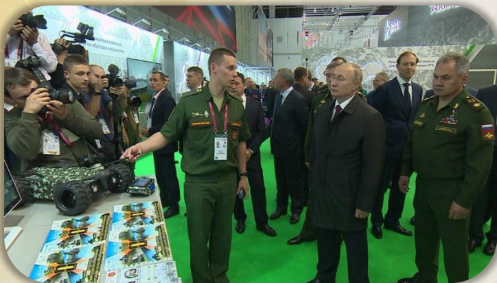
Представление экспонатов Президенту Российской Федерации