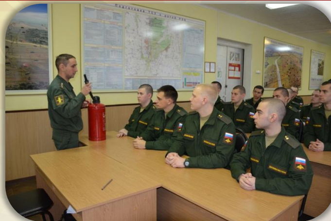
Инструктаж по технике безопасности