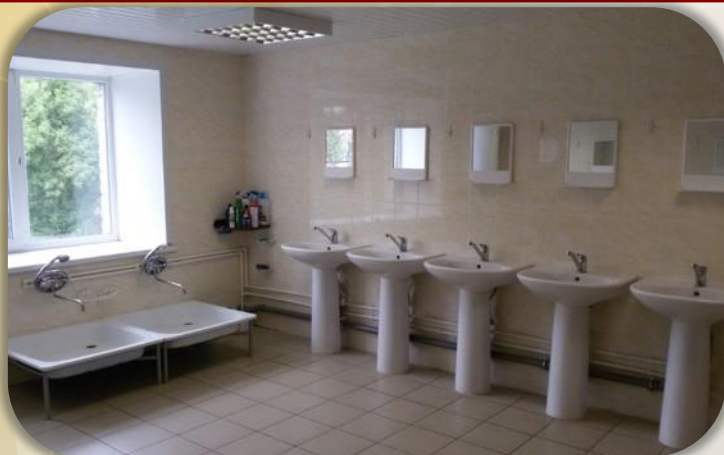
Комната для умывания