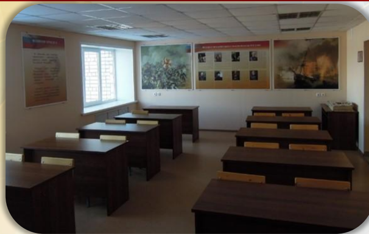
Комната информирования и досуга