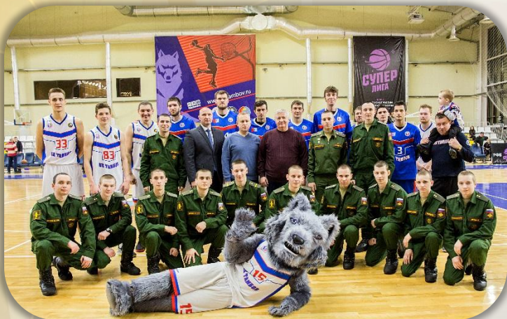
Посещение баскетбольного матча