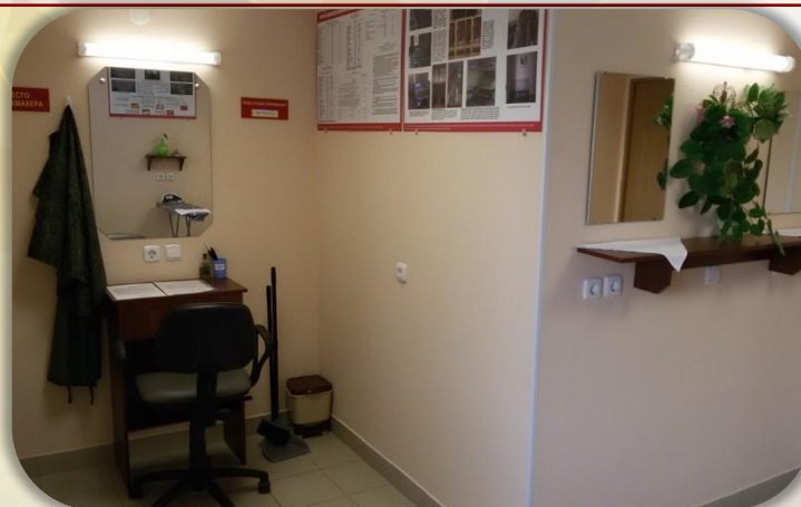
Комната бытового обслуживания