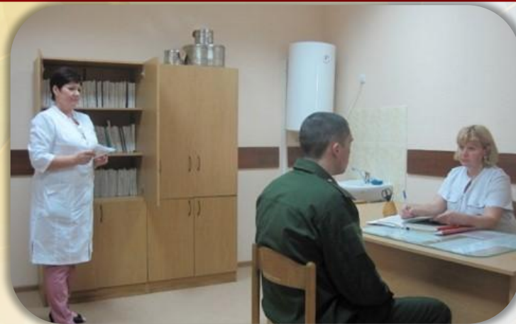
Регистратура, первичный осмотр