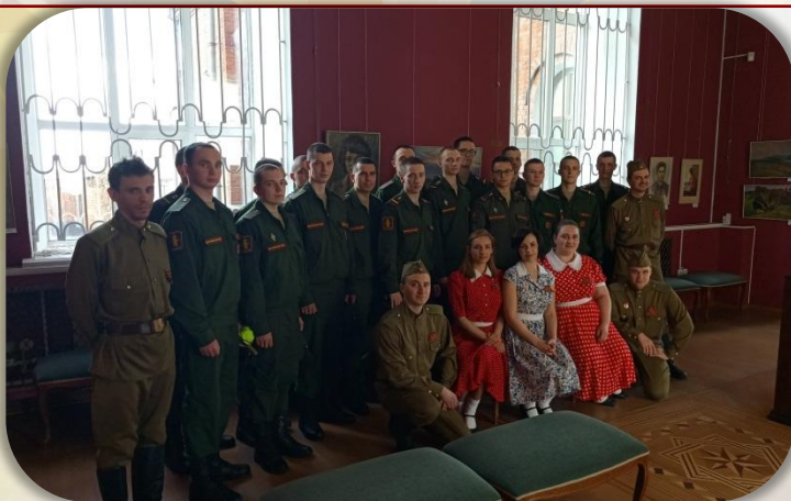
Посещение картинной галереи