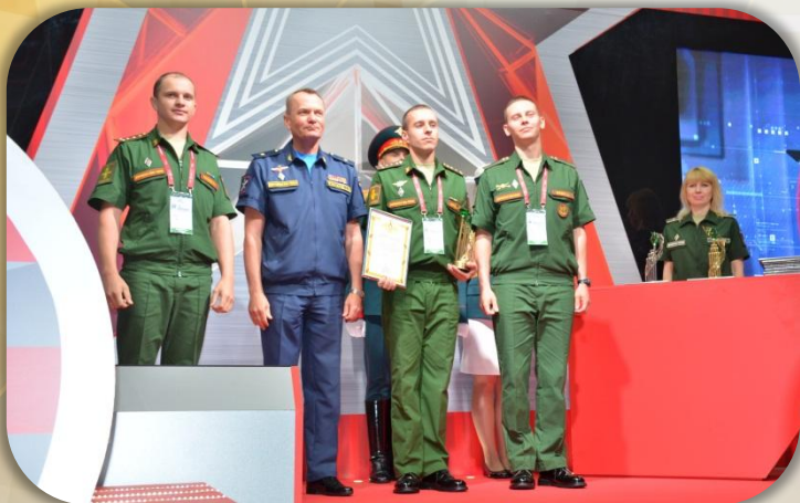
Награждение научной роты начальником ГУНИД