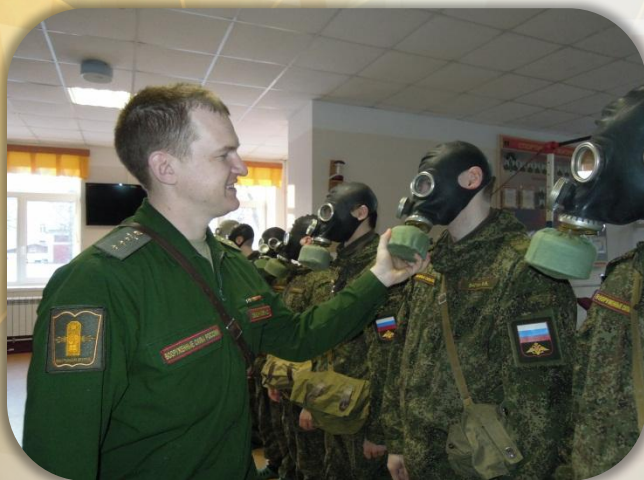
Занятие по РХБЗ