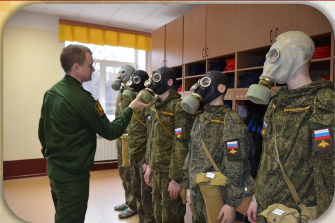
Подгонка средств индивидуальной защиты