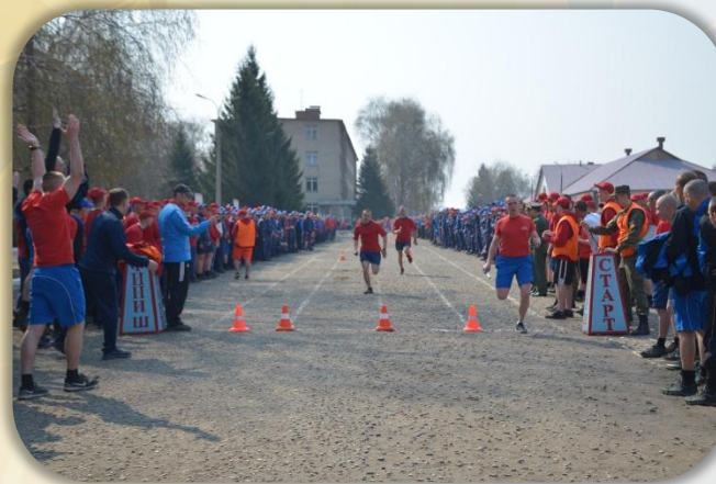
Занятие по физической подготовке