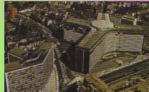
Здание Европейского союза в Брюсселе