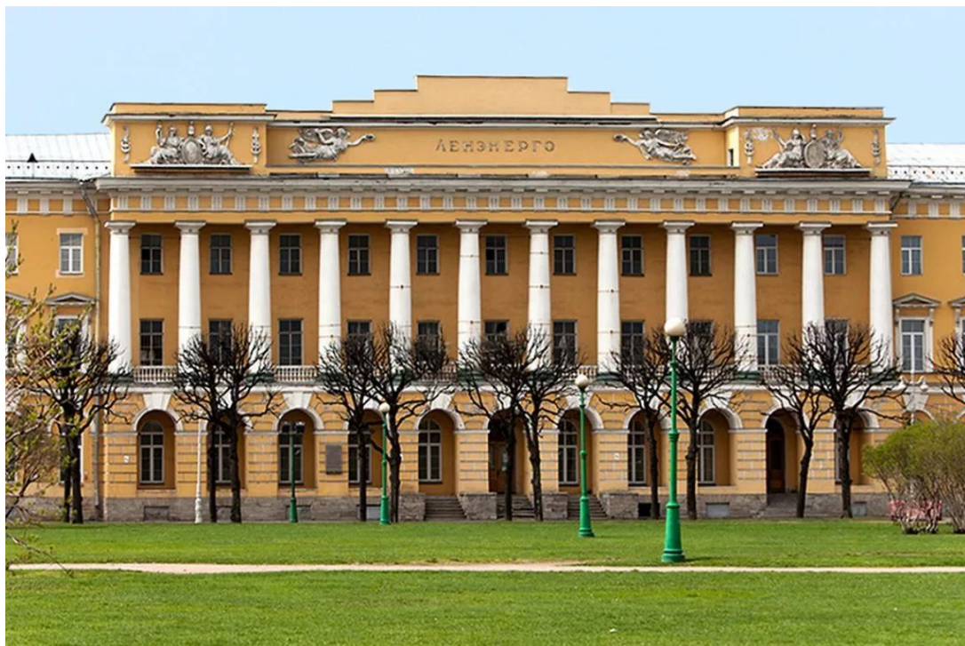
ЗДАНИЕ ПАВЛОВСКИХ КАЗАРМ В.П. СТАСОВ