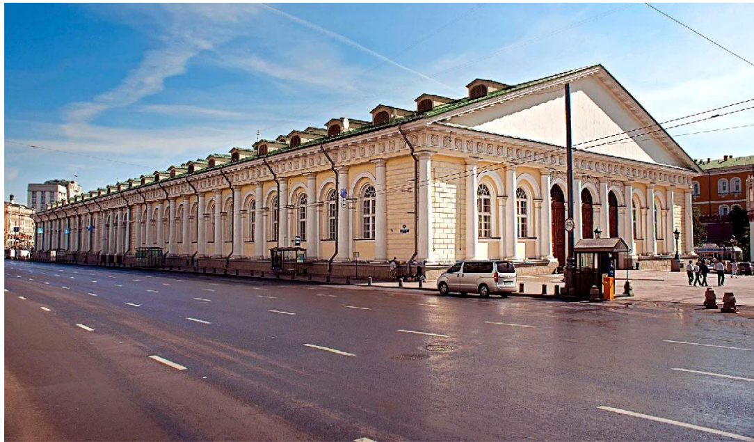
ЗДАНИЕ МАНЕЖА А.А. БЕТАНКУР