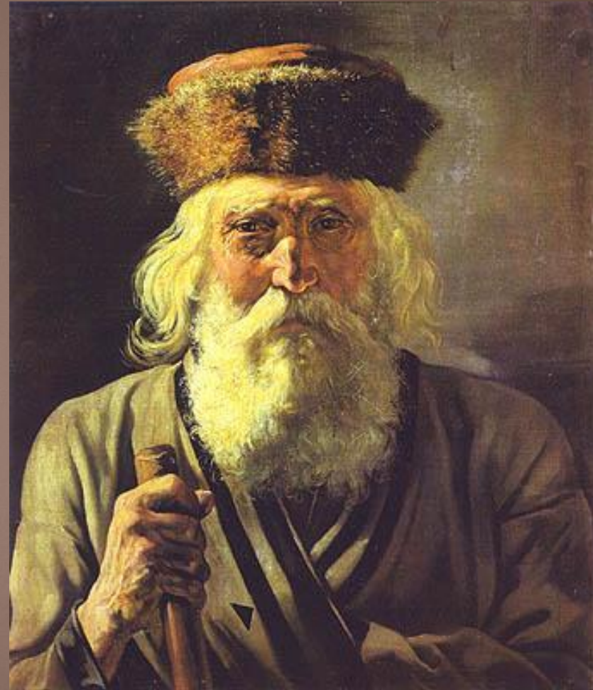
Странник. 1859. Саратовский художественный музей

Василий Григорьевич Перов (21 декабря 1833 (2 января 1834), Тобольск — 29 мая (10 июня) 1882) — русский живописец, один из членов-учредителей Товарищества передвижных художественных выставок.