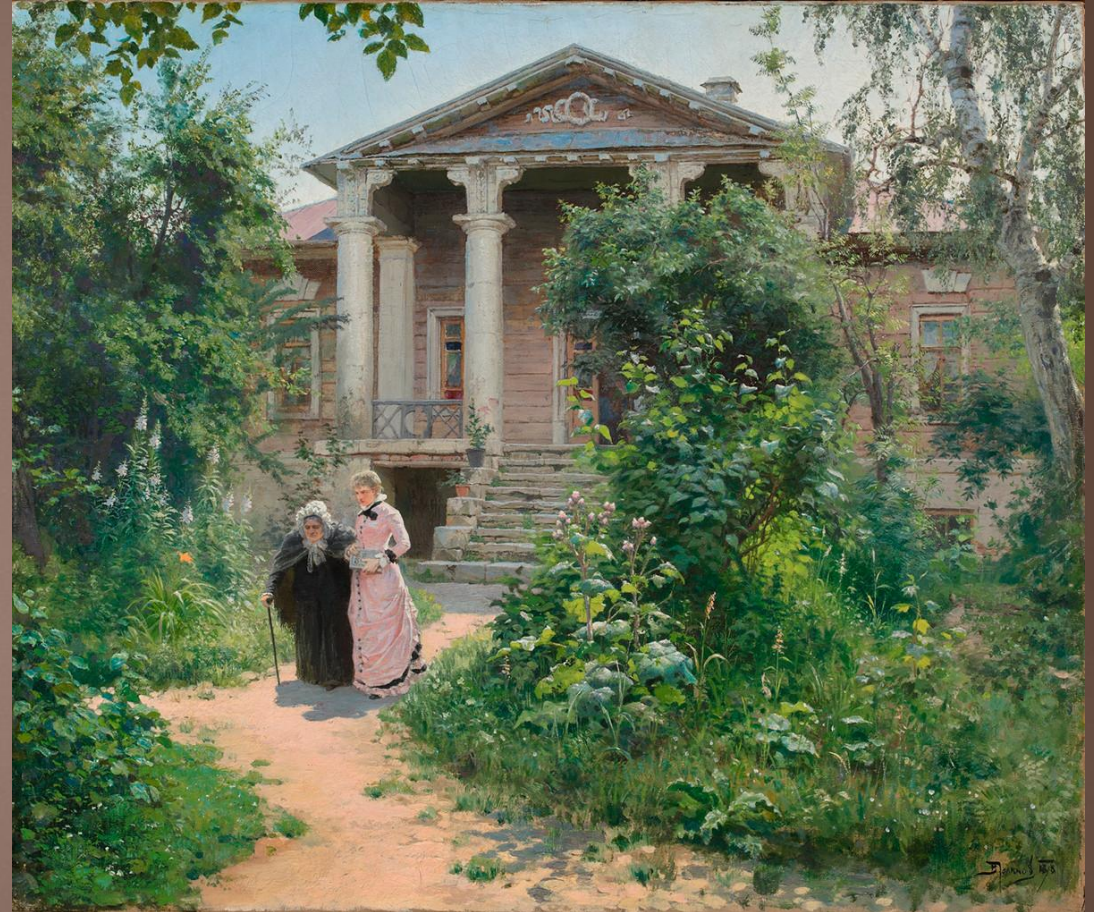
Василий Дмитриевич Поленов

В число передвижников входили Василий Перов, Алексей Саврасов, Иван Шишкин, Илья Репин, Николай Ге, Василий Поленов, Виктор и Аполлинарий Васнецовы, Василий Суриков, Архип Куинджи, Исаак Левитан, Владимир и Константин Маковские, Валентин Серов и, конечно, Иван Крамской, предводитель движения.