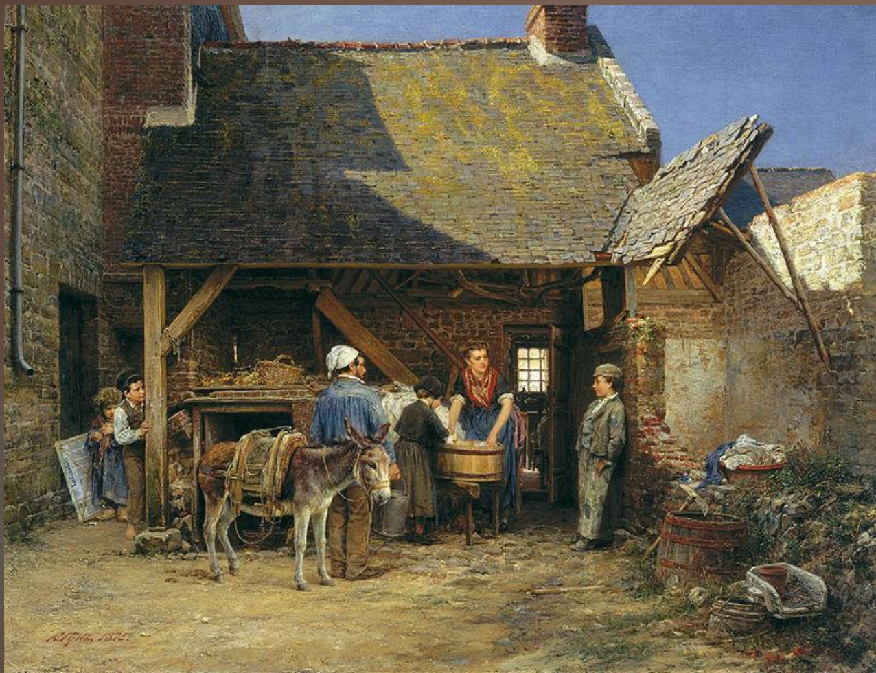
«Попался!», (1875), холст, масло — Государственная Третьяковская галерея.