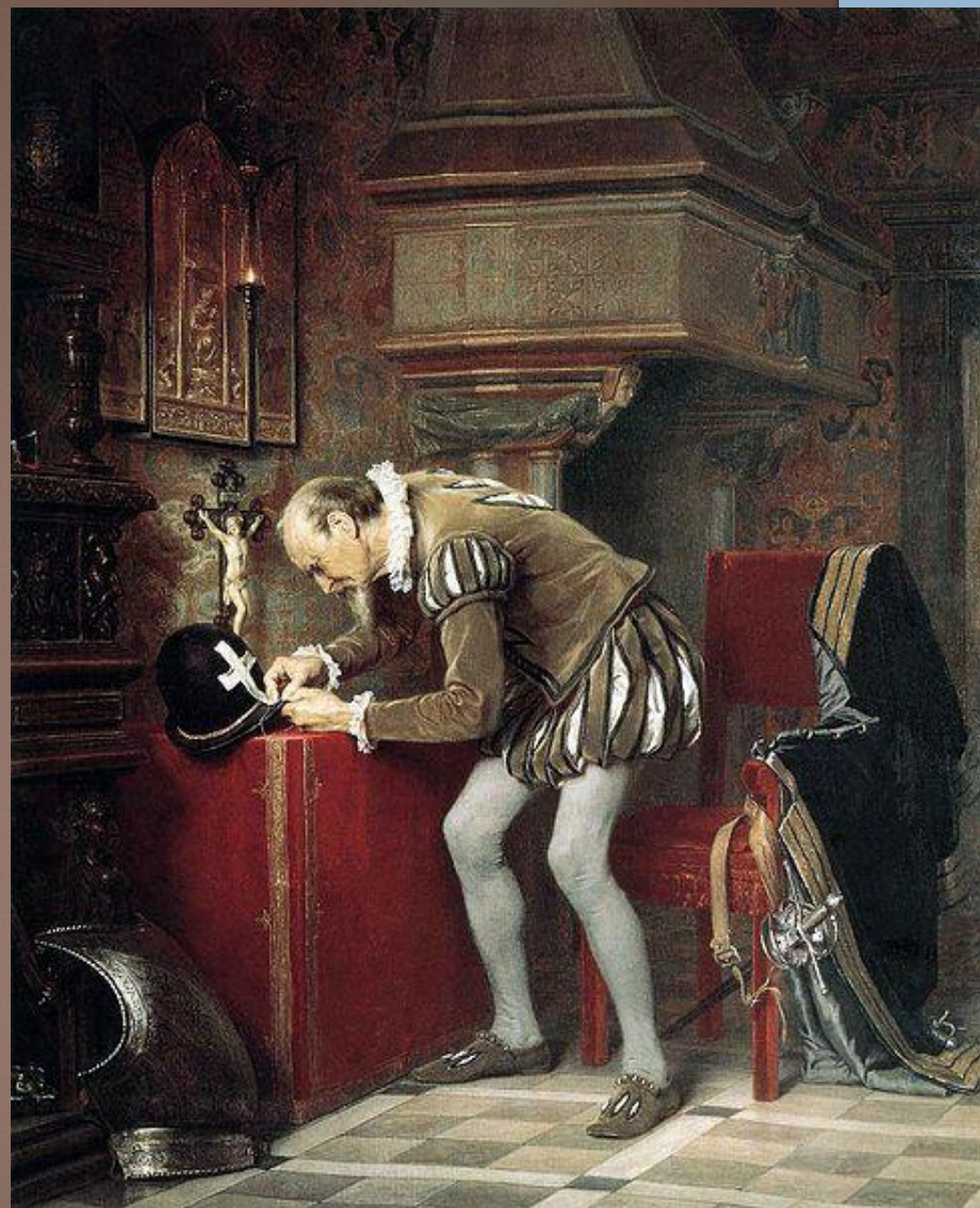
«Канун Варфоломеевской ночи», (1868), холст, масло — Государственный Русский музей.