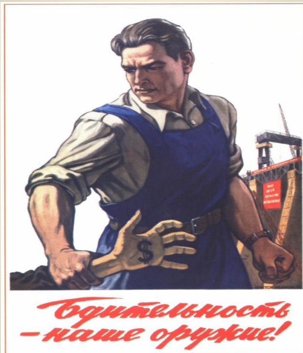
322. Иванов В. Бдительность — наше оружие! 1953