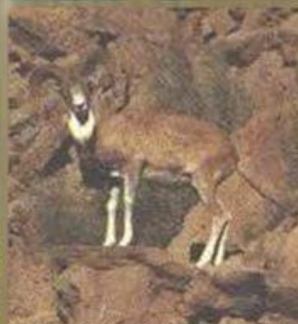
Устьюртский горный баран