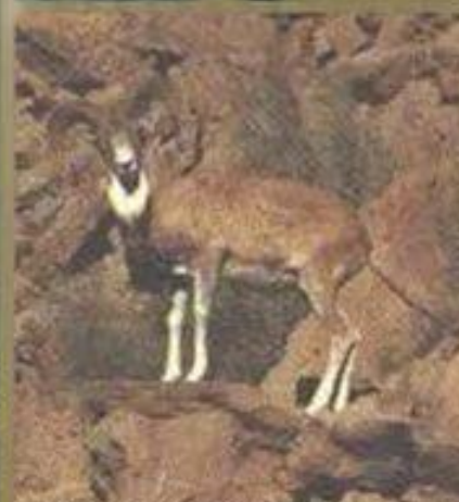
Устюртский горный баран