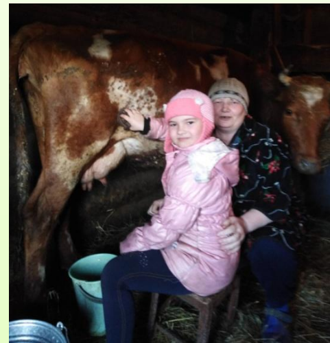
Акция «Помощь бабушке»