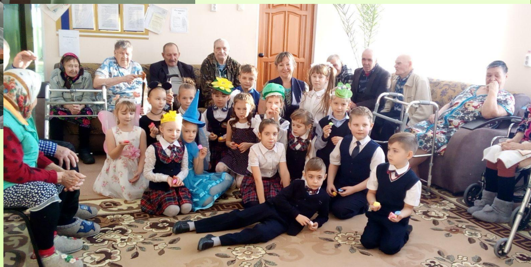
Театральная инсценировка « Бабушки- это мамы наших мам...»