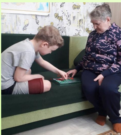
Час общения с одинокими людьми