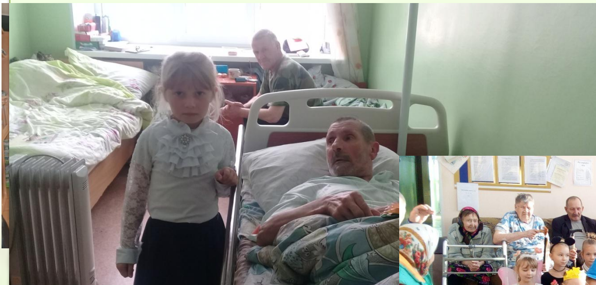
Помощь своему соседу- дедушке