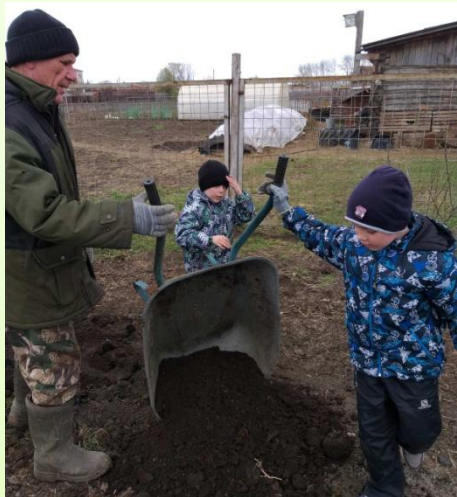
Помощь своему соседу- дедушке