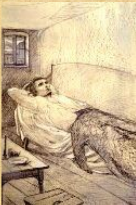
«Раскольников» И. Глазунов