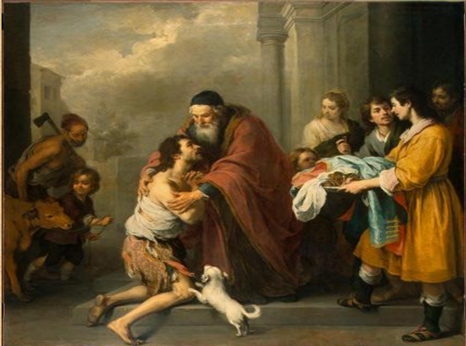
«Возвращение блудного сына» Бартоломео