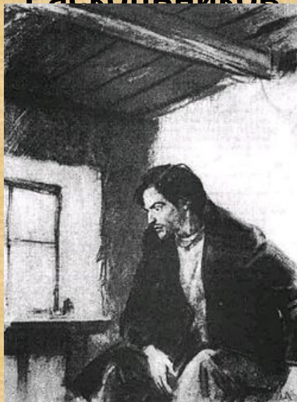
«Раскольников» Шмаринов Д. А.