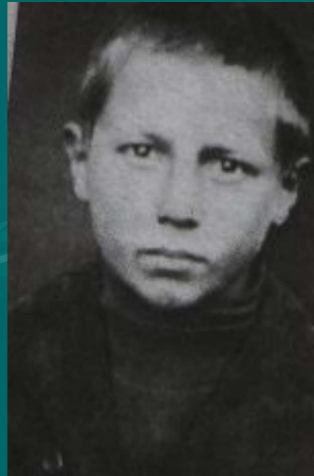
Шәүкәткә 11 яшь.