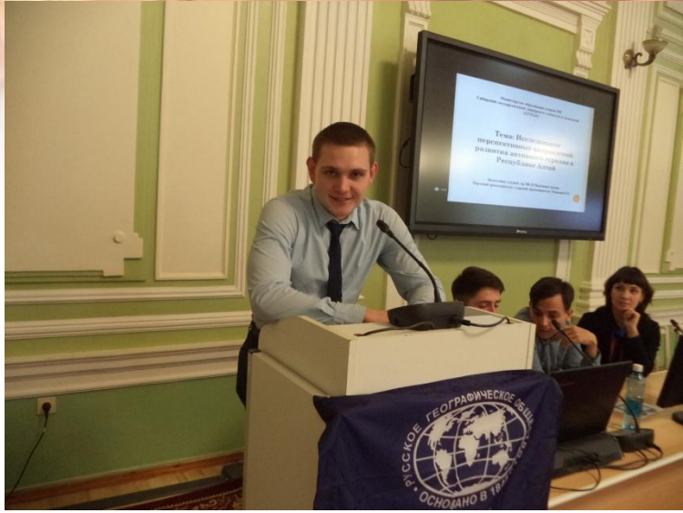
XVI Международная научно-практическая конференция «Возможности развития краеведения и туризма Сибирского региона и сопредельных территорий» (г. Томск)