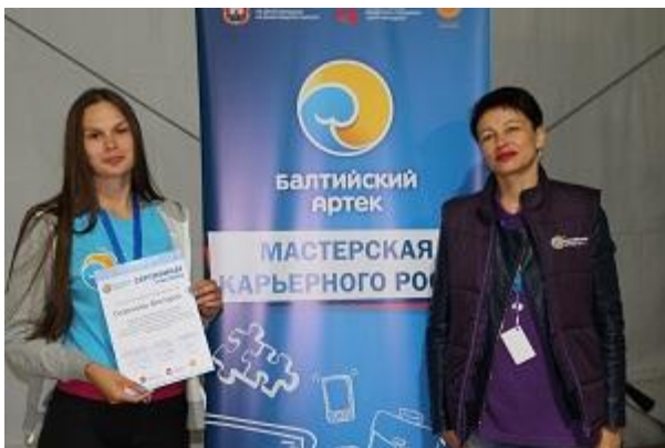
Региональная смена «Молодёжь будущего» Всероссийского молодёжного образовательного форума «Балтийский Артек» (Калининградская область)