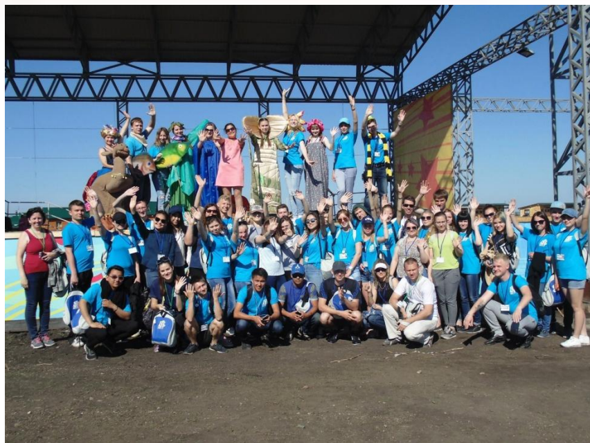
Участие в IX Международном молодёжном управленческом форуме «Алтай. Точки Роста» (Белокуриха)