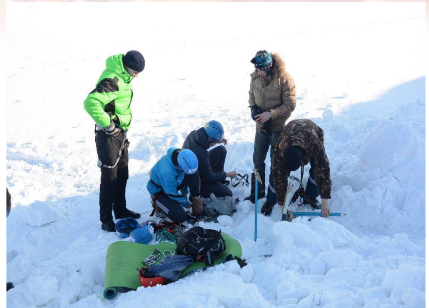
Турклуб СГУГиТ. Участие в областных мероприятиях школы спортивного туризма «Шаг вперед»