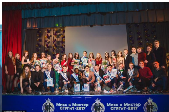
Мисс и Мистер СГУГиТ