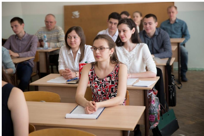
Межвузовская (Региональная) научная студенческая конференция «Интеллектуальный потенциал Сибири»