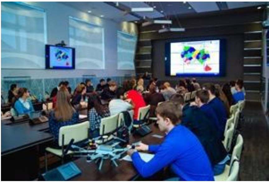
Участие в питч-сессии «Поколение идей»