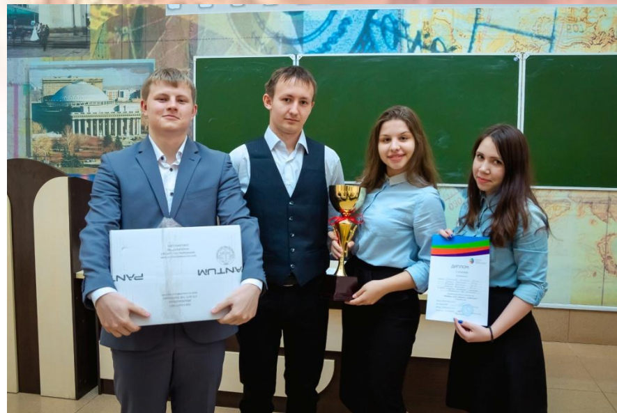
Межвузовская проектно-ролевая игра «Выбери мой проект, инвестор!».