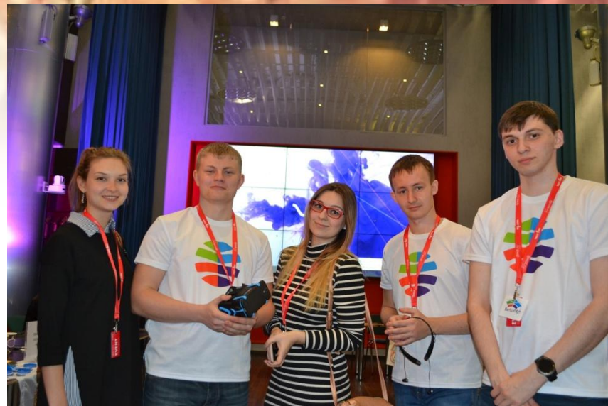
Участие в финальном этапе Всероссийского конкурса университетских команд «Кубок Преактум» (Москва)