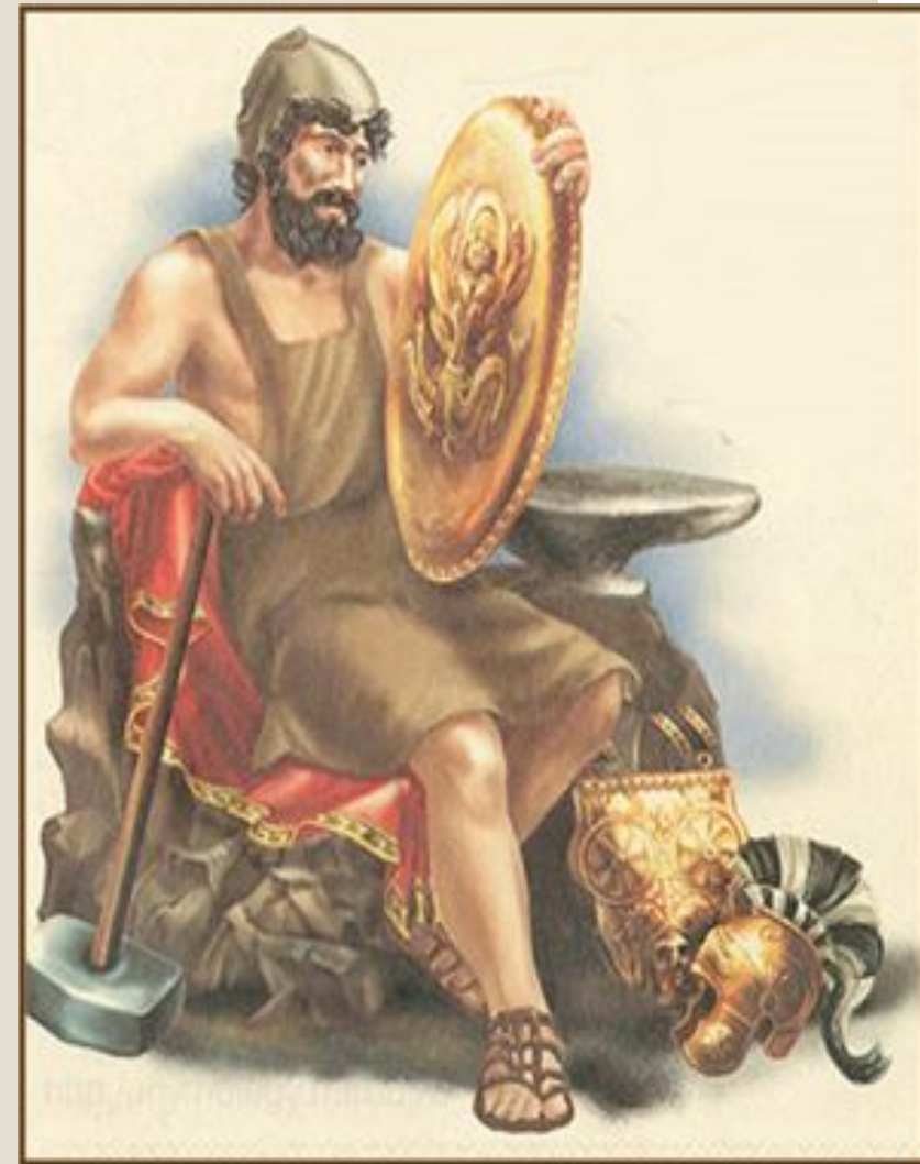
Древнеримский бог кузнечного дела Вулкан