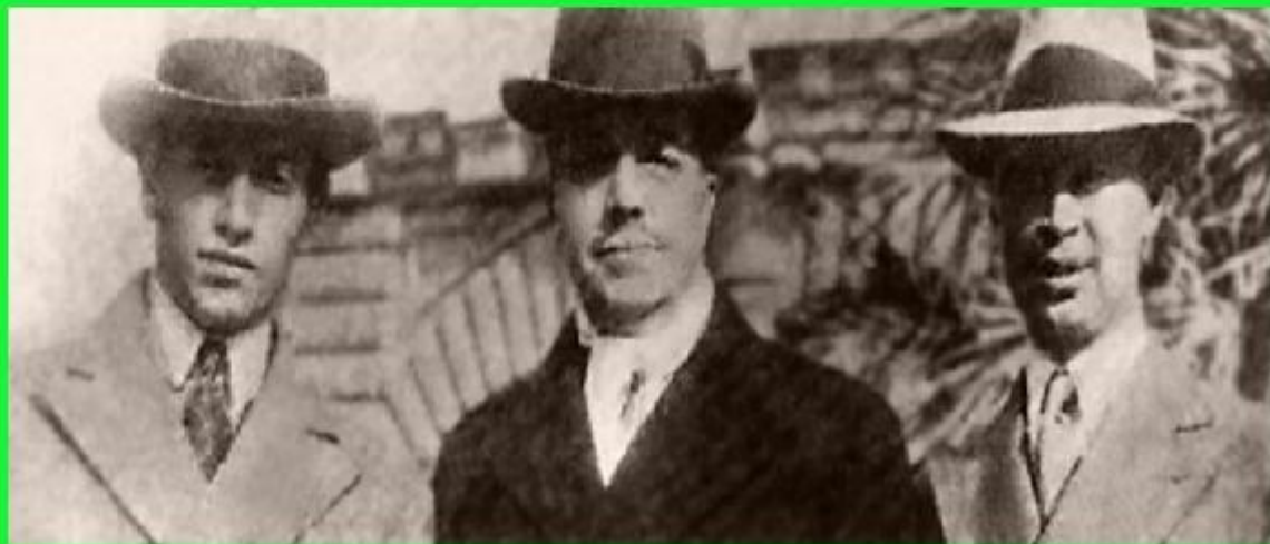
Сергей Лифарь, Сергей Дягилев и Сергей Прокофьев