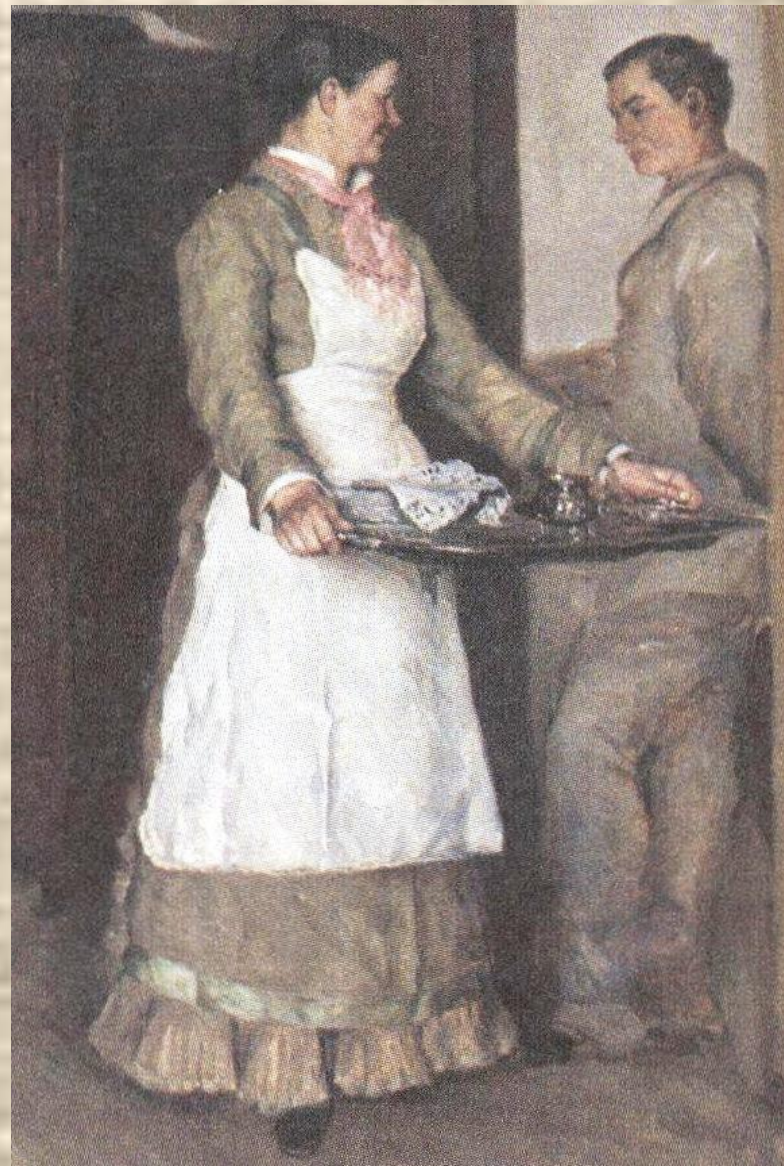
Алексей Корзухин. В комнатах.