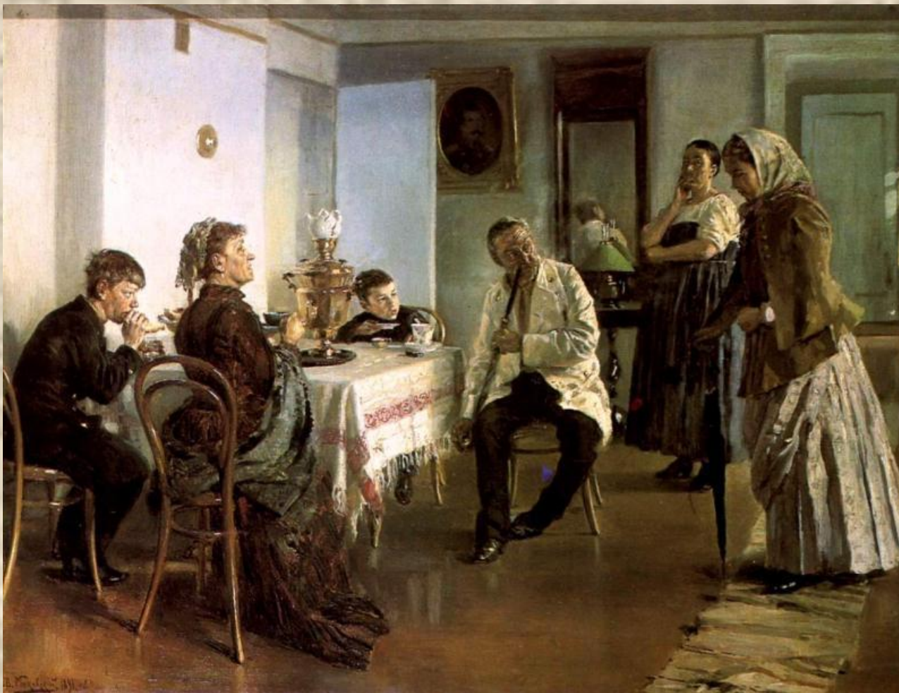
Владимир Маковский. Наем прислуги. 1891