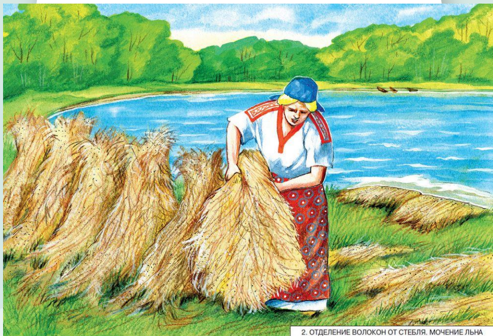
2. ОТДЕЛЕНИЕ ВОЛОКОН ОТ СТЕБЛЯ. МОЧЕНИЕ ЛЬНА