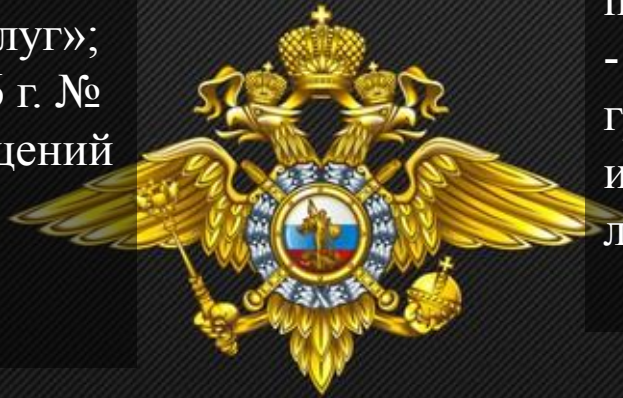
Министерство внутренних дел Российской Федерации