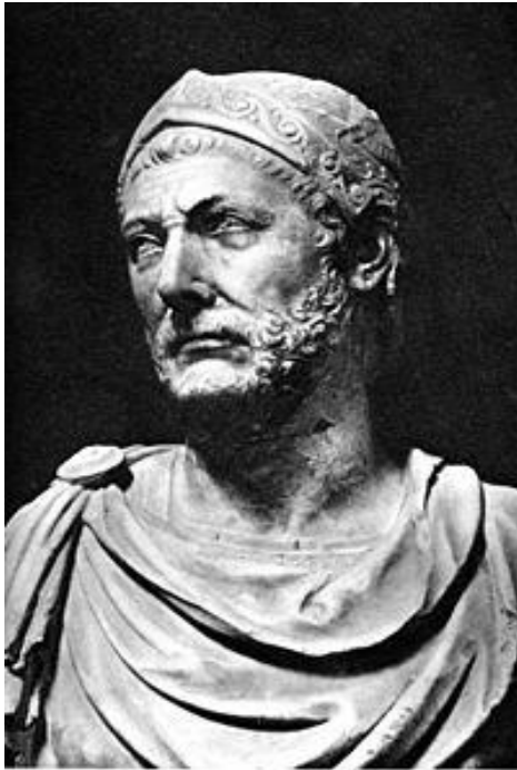
Hannibal. (Napoli, National Museum.)