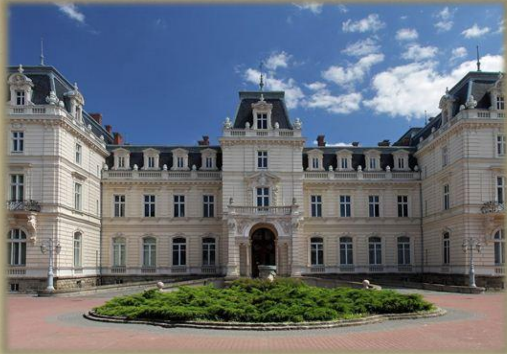
Der Palast von Potocki