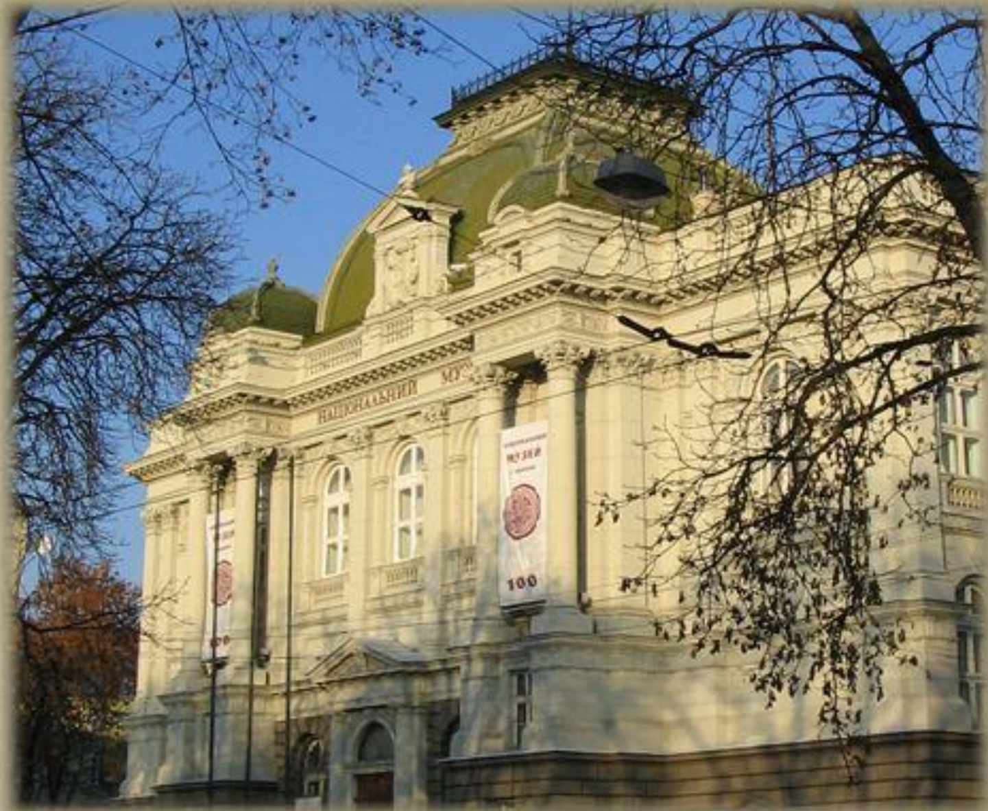
Das Nationalmuseum Lemberg