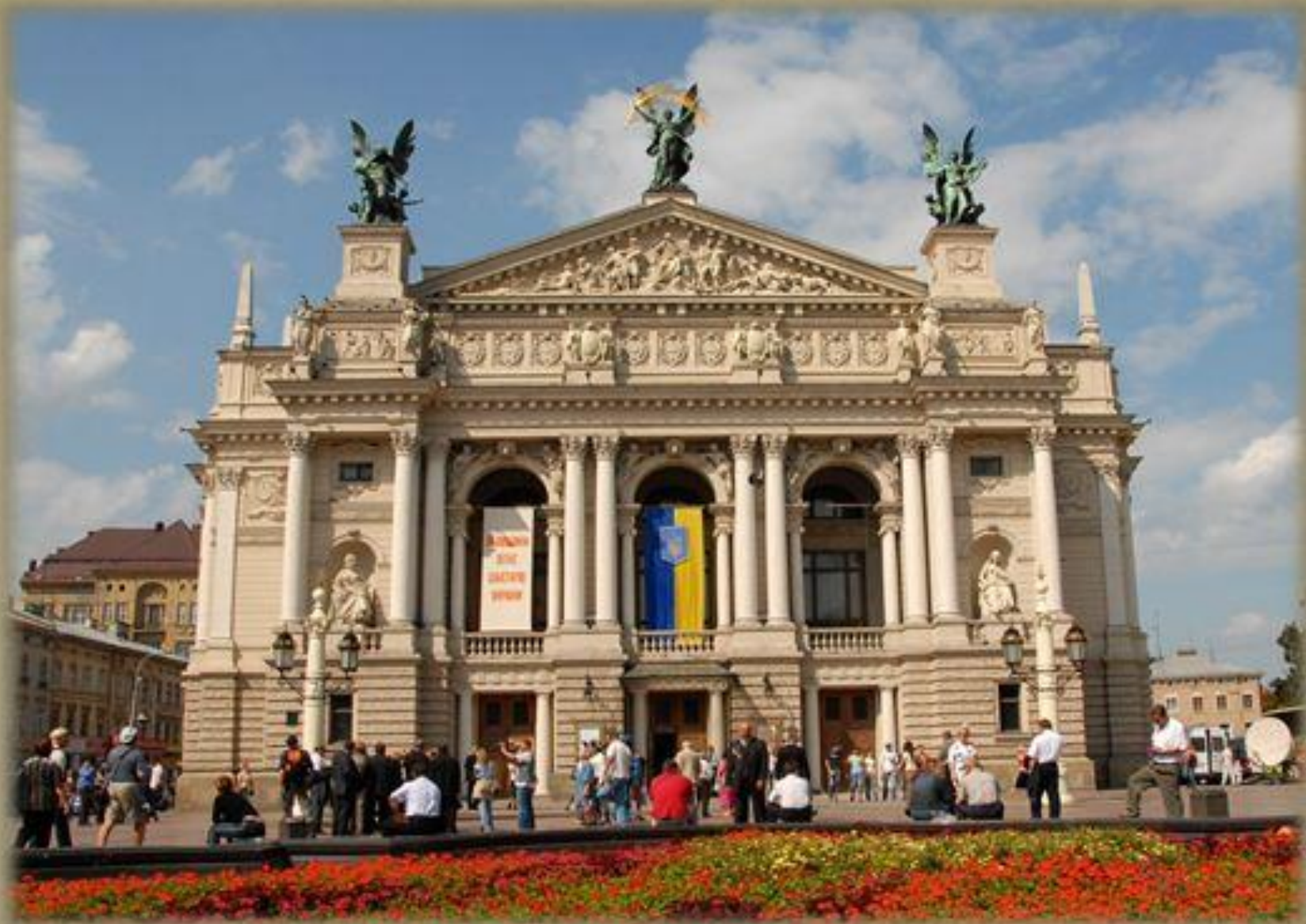
Das Opernhaus in Lwiw