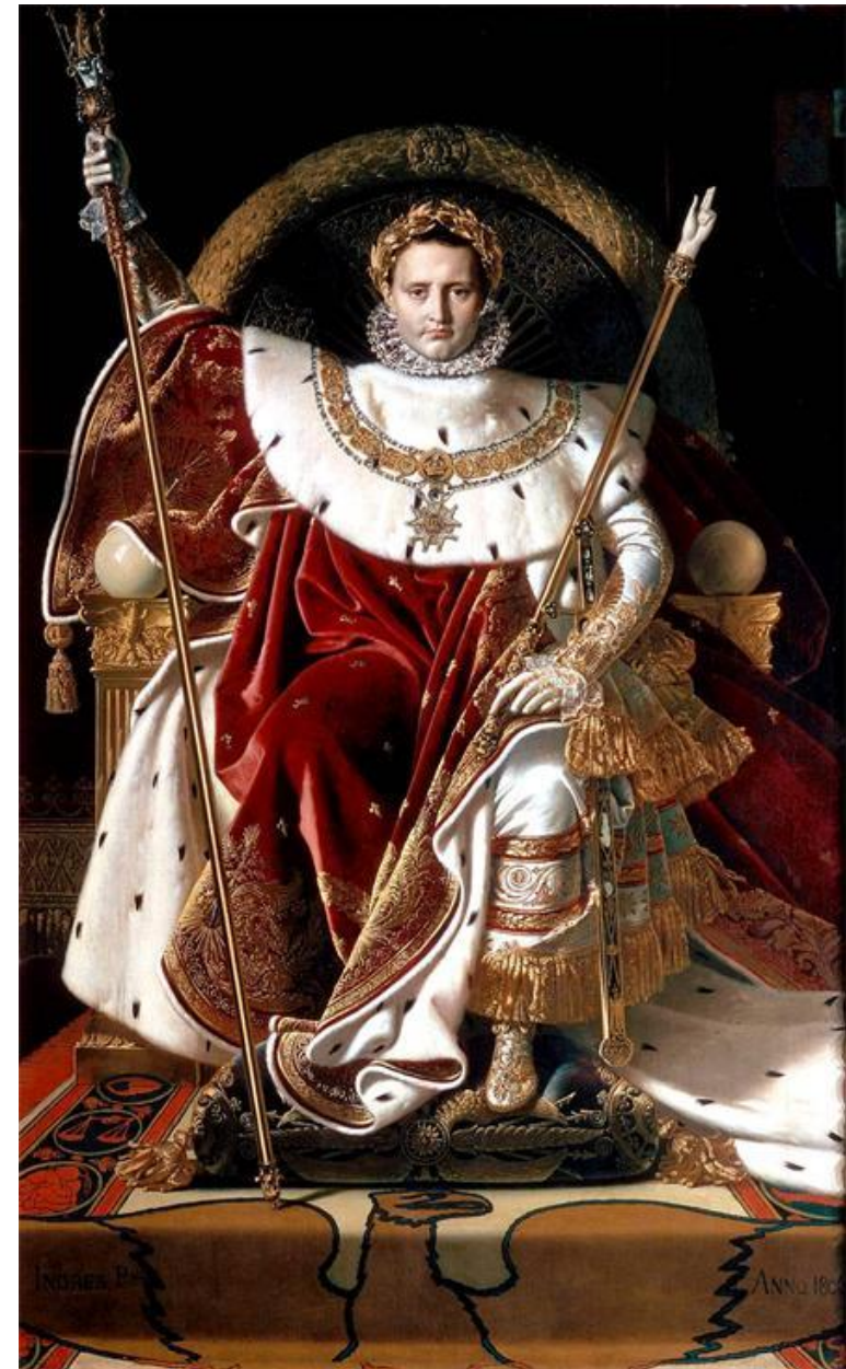
Наполеон Бонапарт (1769-1821)