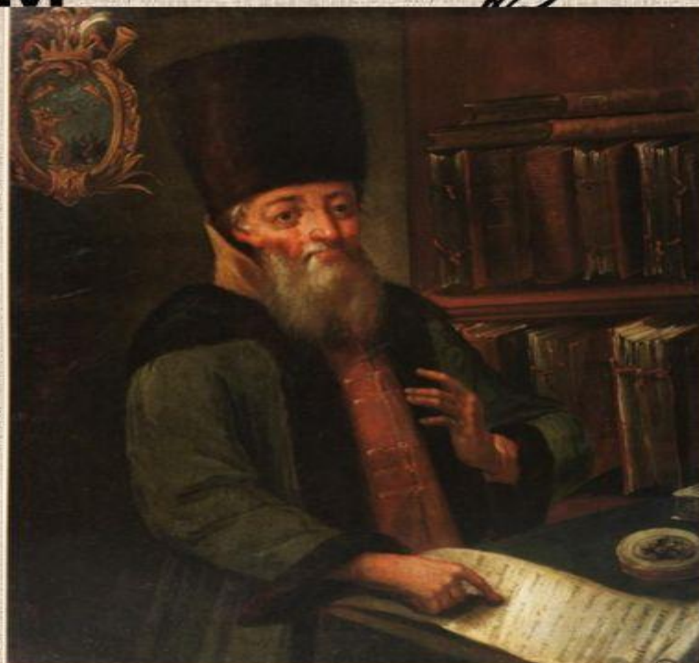
Инициатор принятия Новоторгового Устава А.Л. Ордин-Нащокин Shared