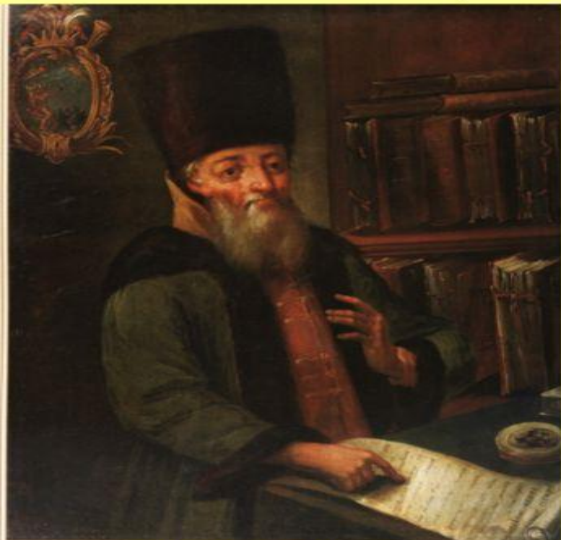
Инициатор принятия Новоторгового Устава А.Л. Ордин-Нащокин

В 1667 г. был принят Новоторговый устав.