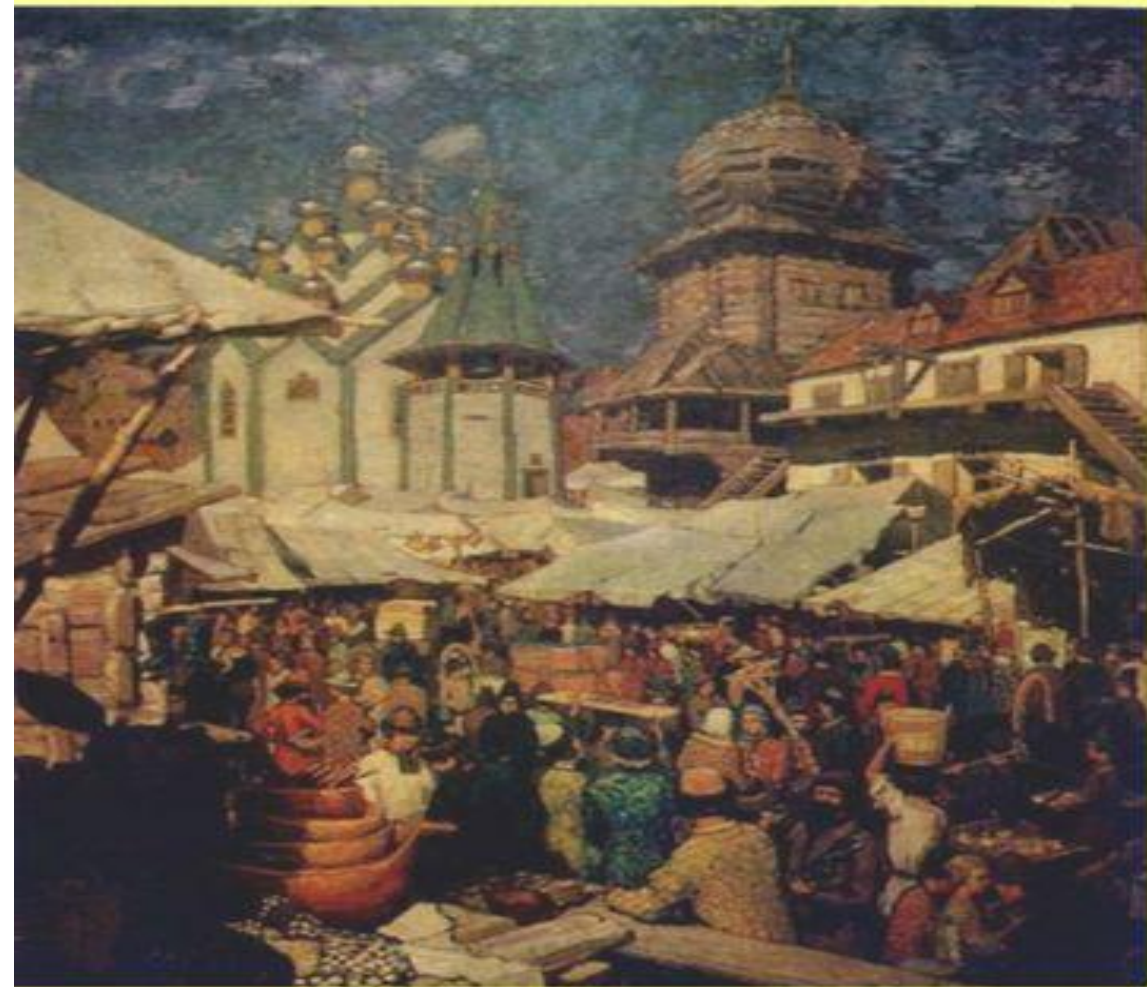
Базар XVII века Худ. А. Васнецов

Оптовые продажи совершались на ярмарках, куда свозились крупные партии товаров.