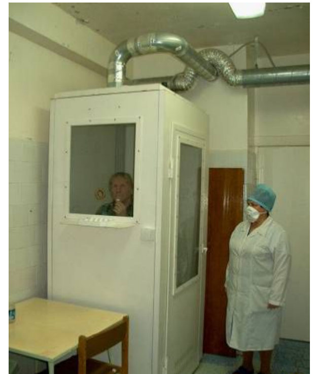
Гигиеническая (кашлевая) кабина сбора