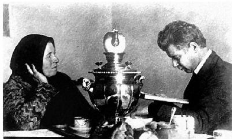
Фото 1925 года Есенин с матерью

Пишут мне, что ты, тая тревогу, Загрустила шибко обо мне, Что ты часто ходишь на дорогу В старомодном ветхом шушуне.