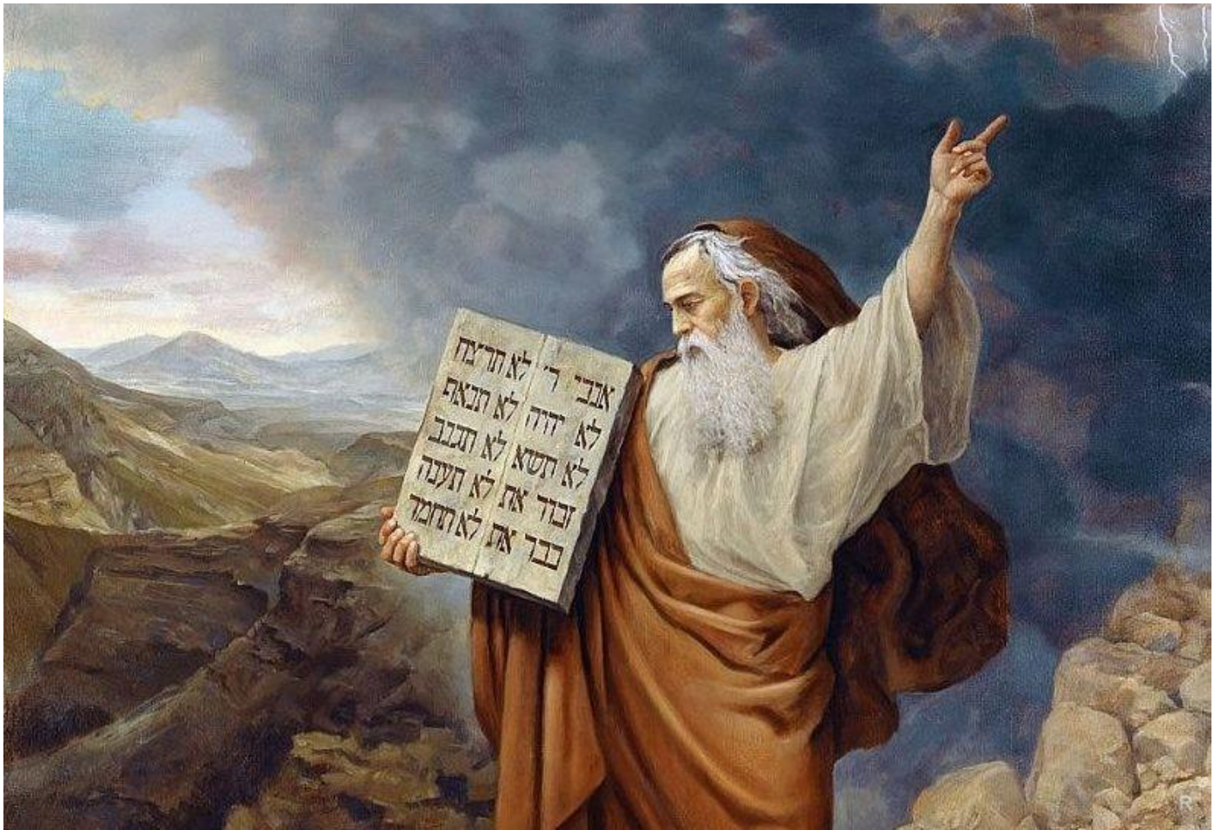
Пророк Моисей принёс людям заповеди от Бога