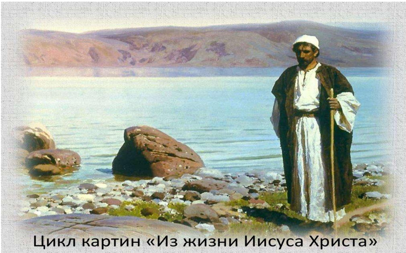
Цикл картин «Из жизни Иисуса Христа»