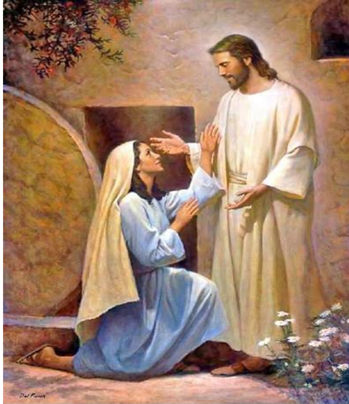
Mary Magdalene with Jesus by Del Parson