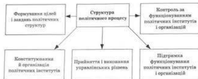
Рис. 4.1: Структурні елементи політичного процесу