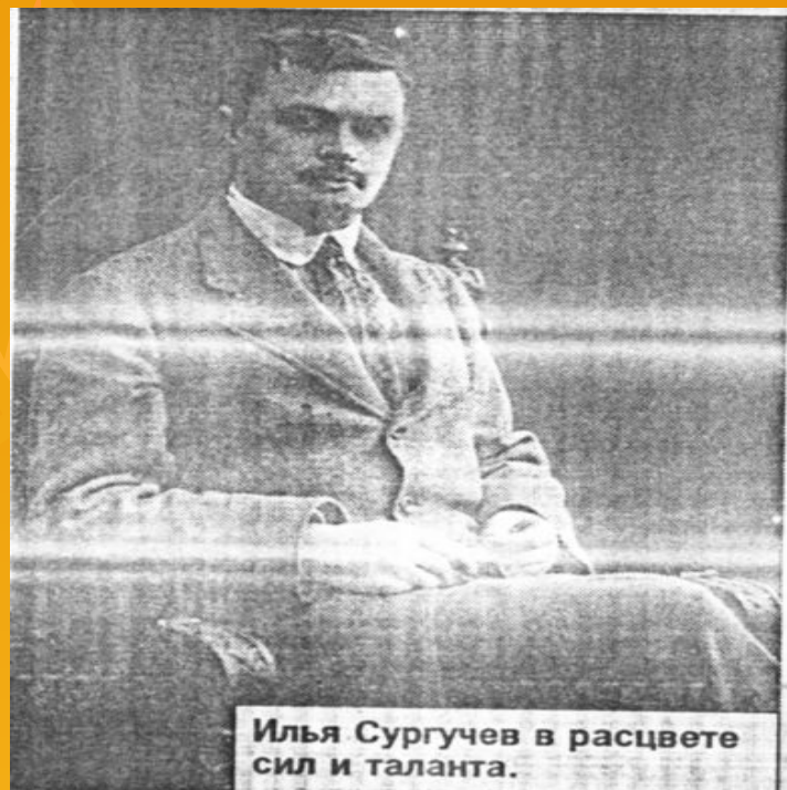
Илья Сургучев в расцвете сил и таланта.

Однако Илья Дмитриевич был вынужден уехать из России. Дело в том, что Сургучев, видя произвол и беззаконие, царившие в период установления советской власти в