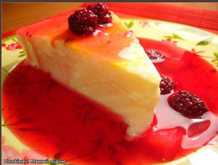
Plombieres. Маннны пудинг