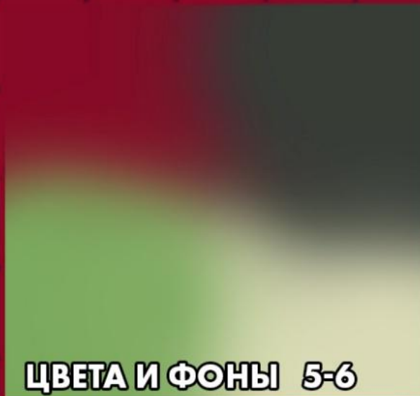
ЦВЕТА И ФОНЫ 5-6