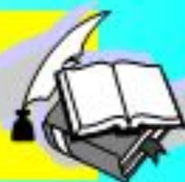
Схема научного стиля речи