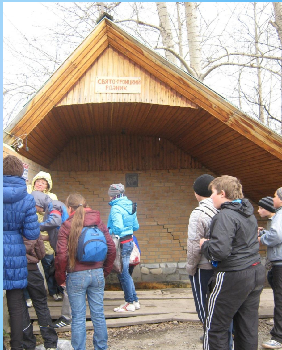
«Свято - Троицкий» родник