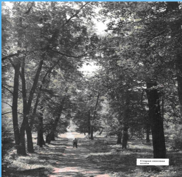
Старая липовая аллея