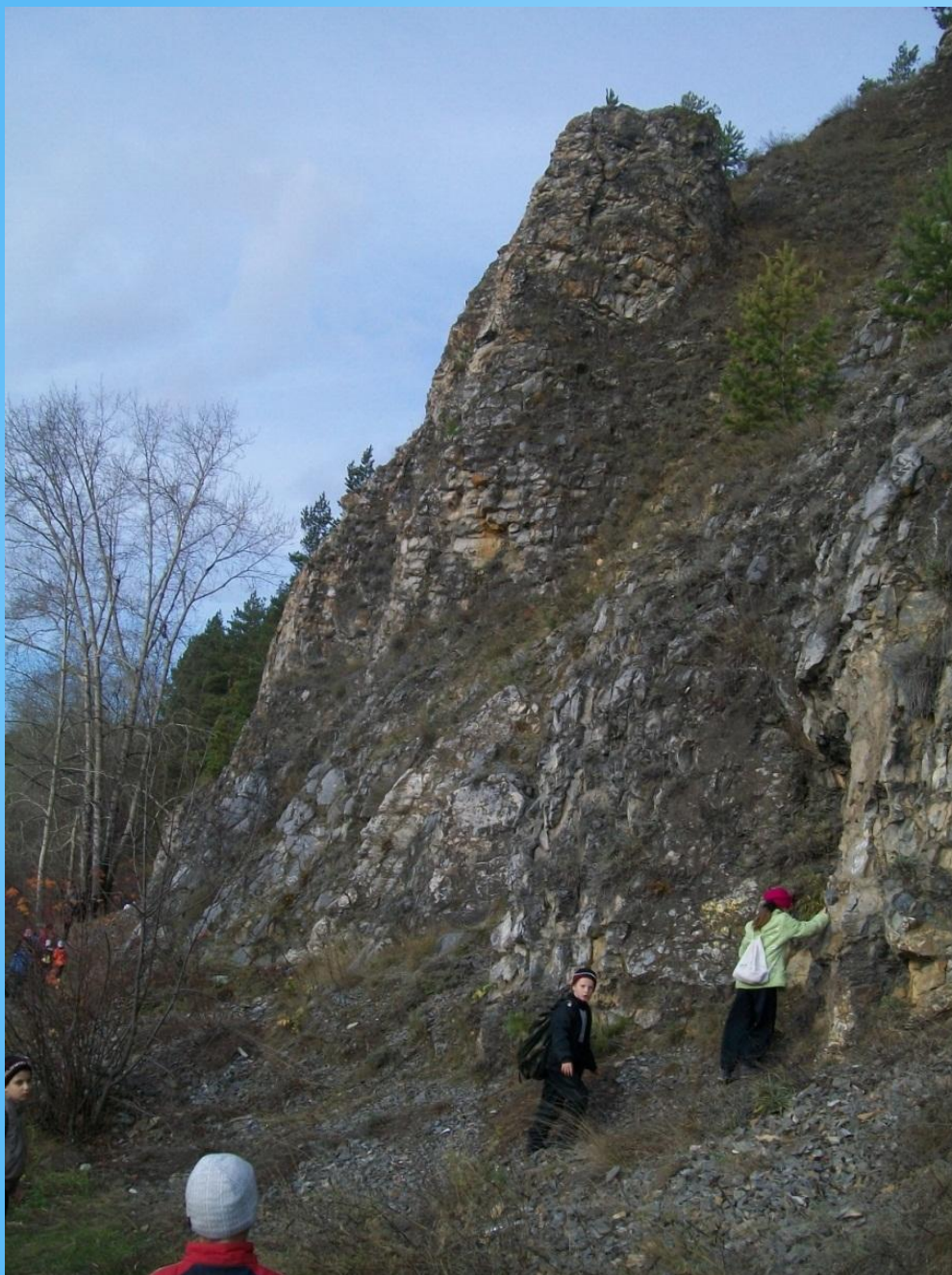
Скала «Три сестры»