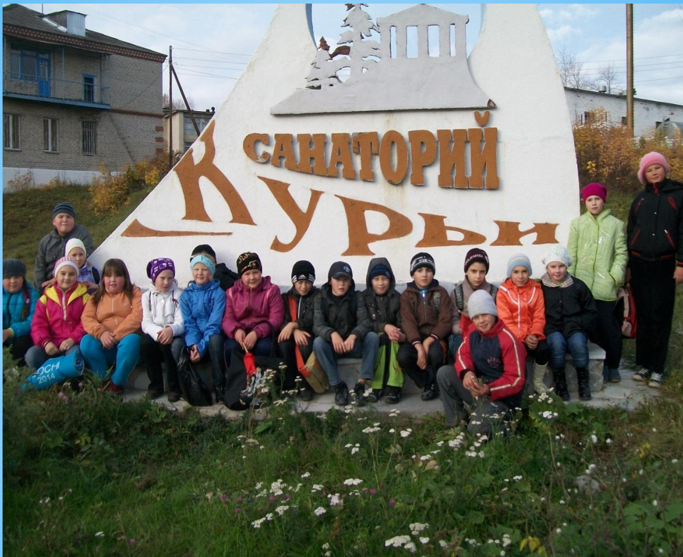
Стелла санатория «Курорт «Курьи»