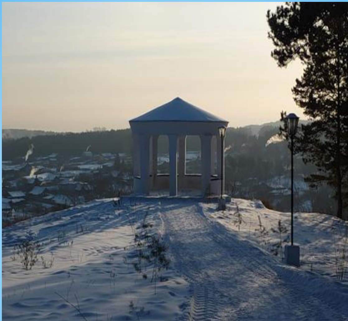
Беседка на скале «Три сестры»