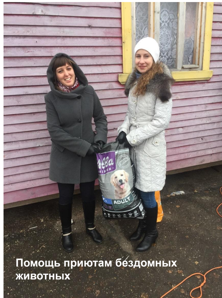
Помощь приютам бездомных животных