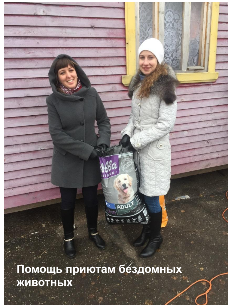
Помощь приютам бездомных животных