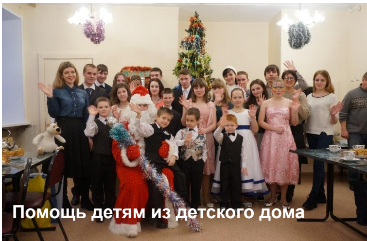
Помощь детям из детского дома

Волонтерская деятельность. У нас существует своя волонтерская команда, которая занимается реализацией добровольческих инициатив.