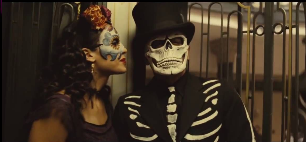
«James Bond 007»