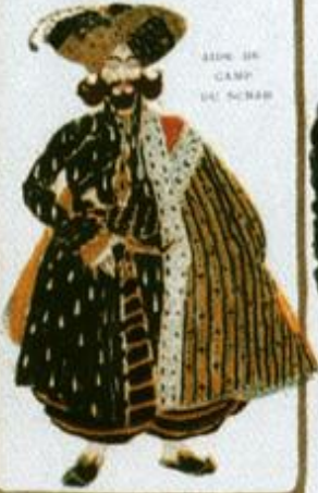
BÉLUC DU CAMP DU SERRAS