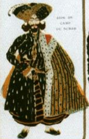
BÉLIM DE CAMP VAL SCHEH