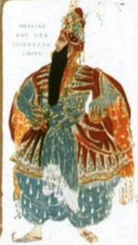
SHAGAR HAI HEN

Tous ceux qui ont pu voir le ballet oriental "SHÉHÉRAZADE", dansé à l'Opéra par les danseurs russes, sur l'admirable musique de Rimsky-Korsakof, savent quelle part considérable les costumes et les décors tiennent, dans le succès à Paris, de ce drame chorégraphique.