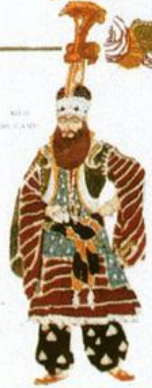
MELI DE CAMP