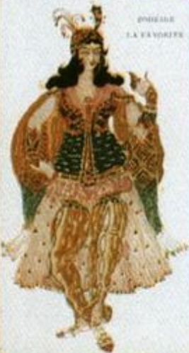
ONIEGHE LA FAVORITE