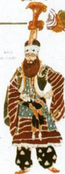
BÉLIM DE CAMP