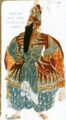
SHAGAR HAI HEN SHAGAR HAI HEN

Tous ceux qui ont pu voir le ballet oriental "SHÉHÉRAZADE", dansé à l'Opéra par les danseurs russes, sur l'admirable musique de Rimsky-Korsakof, savent quelle part considérable les costumes et les décors tiennent, dans le succès à Paris, de ce drame chorégraphique.