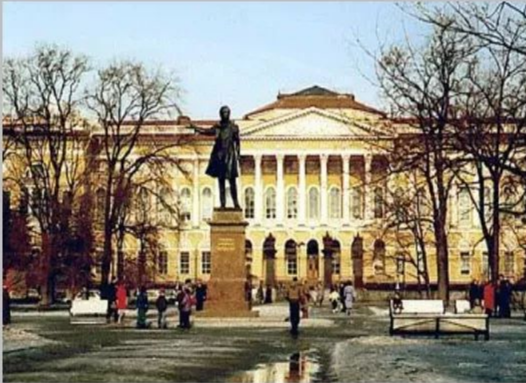
Памятник А.С.Пушкину в Москве. Скульптор А.М.Опекушин. Бронза. 1875г