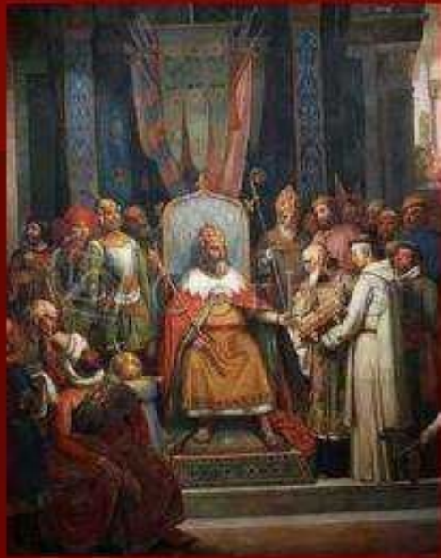
Карл Великий и Алкуин

Для управления обширной страной Карлу Великому нужны были грамотные чиновники и судьи. Он понимал: чтобы возродить Римскую империю, нужно возродить культуру, и прежде всего античные знания. При нем начался подъем культуры, который историки назвали Каролингским Возрождением .