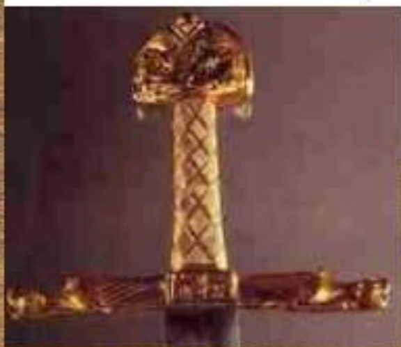
Рукоятка меча Карла Великого

Конец жизни Карла очень обычный, совсем не героический. С 810 года он начинает все время болеть, ему пошел восьмой десяток, для того времени это много лет. Смерть детей, нескольких, умер Пепин в 810 году. Надо сказать, что он был любящий отец и очень тяжело, как описывают современники, переносил смерти своих детей. В 811 умер Карл-младший, наследник престола. И тогда, в 813 году, еще живым, он короновал своего оставшегося единственного сына, Людовика, который получит прозвище Благочестивый, и 28 января, через несколько месяцев, 814 года, умер, не дожив нескольких. Его могила точно не сохранилась.