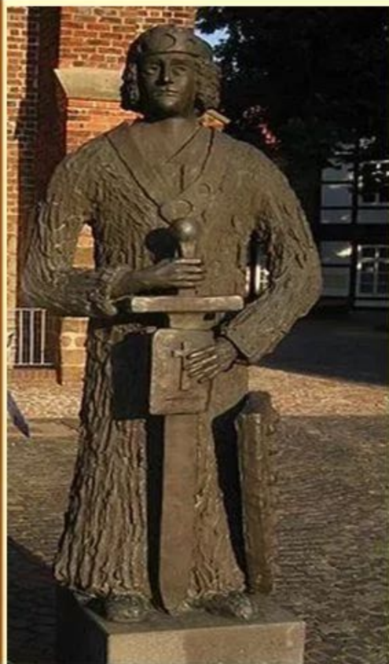
Видукинд – вождь саксов

Карл принуждал саксов принимать христианство. Он ввёл жестокие законы, за малейшее неподчинение королю, за отказ от крещения или отречение от христианской веры, за несоблюдение поста, за похороны по языческому обряду – смерть.