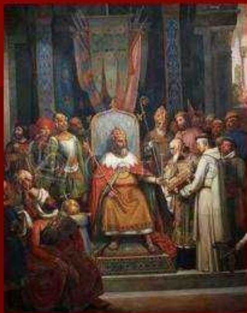
Карл Великий и Алкуин

Для управления обширной страной Карлу Великому нужны были грамотные чиновники и судьи. Он понимал: чтобы возродить Римскую империю, нужно возродить культуру, и прежде всего античные знания. При нем начался подъем культуры, который историки назвали Каролингским Возрождением .