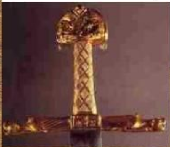
Рукоятка меча Карла Великого

Конец жизни Карла очень обычный, совсем не героический. С 810 года он начинает все время болеть, ему пошел восьмой десяток, для того времени это много лет. Смерть детей, нескольких, умер Пепин в 810 году. Надо сказать, что он был любящий отец и очень тяжело, как описывают современники, переносил смерти своих детей. В 811 умер Карл-младший, наследник престола. И тогда, в 813 году, еще живым, он короновал своего оставшегося единственного сына, Людовика, который получит прозвище Благочестивый, и 28 января, через несколько месяцев, 814 года, умер, не дожив нескольких. Его могила точно не сохранилась.