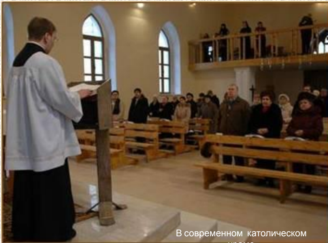
В современном католическом храме

У магометан и католиков послы Владимира не почувствовали никакой духовной красоты.