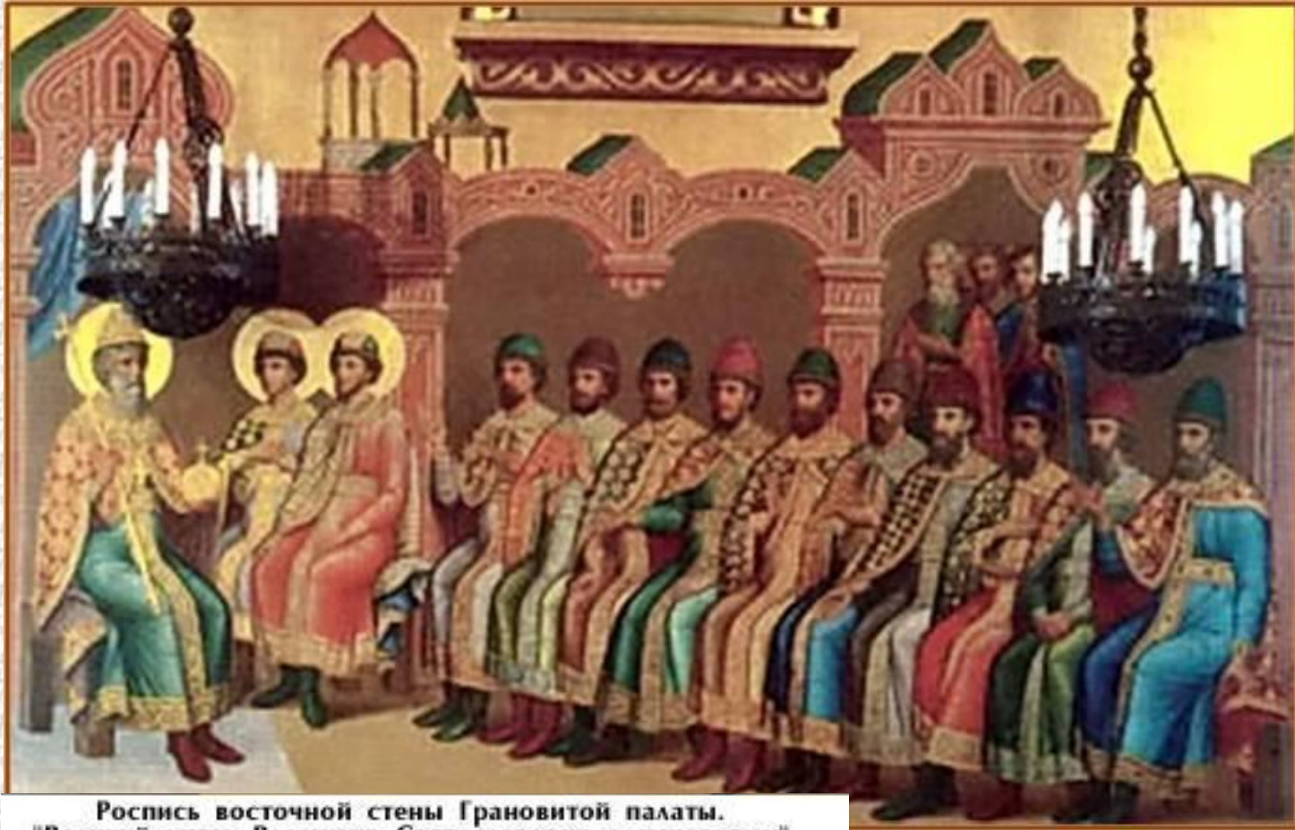
Роспись восточной стены Грановитой палаты. "Великий князь Владимир Святославович с сыновьями"

Возвратившись в Киев, великий князь Владимир прежде всего крестил двенадцать своих сыновей.