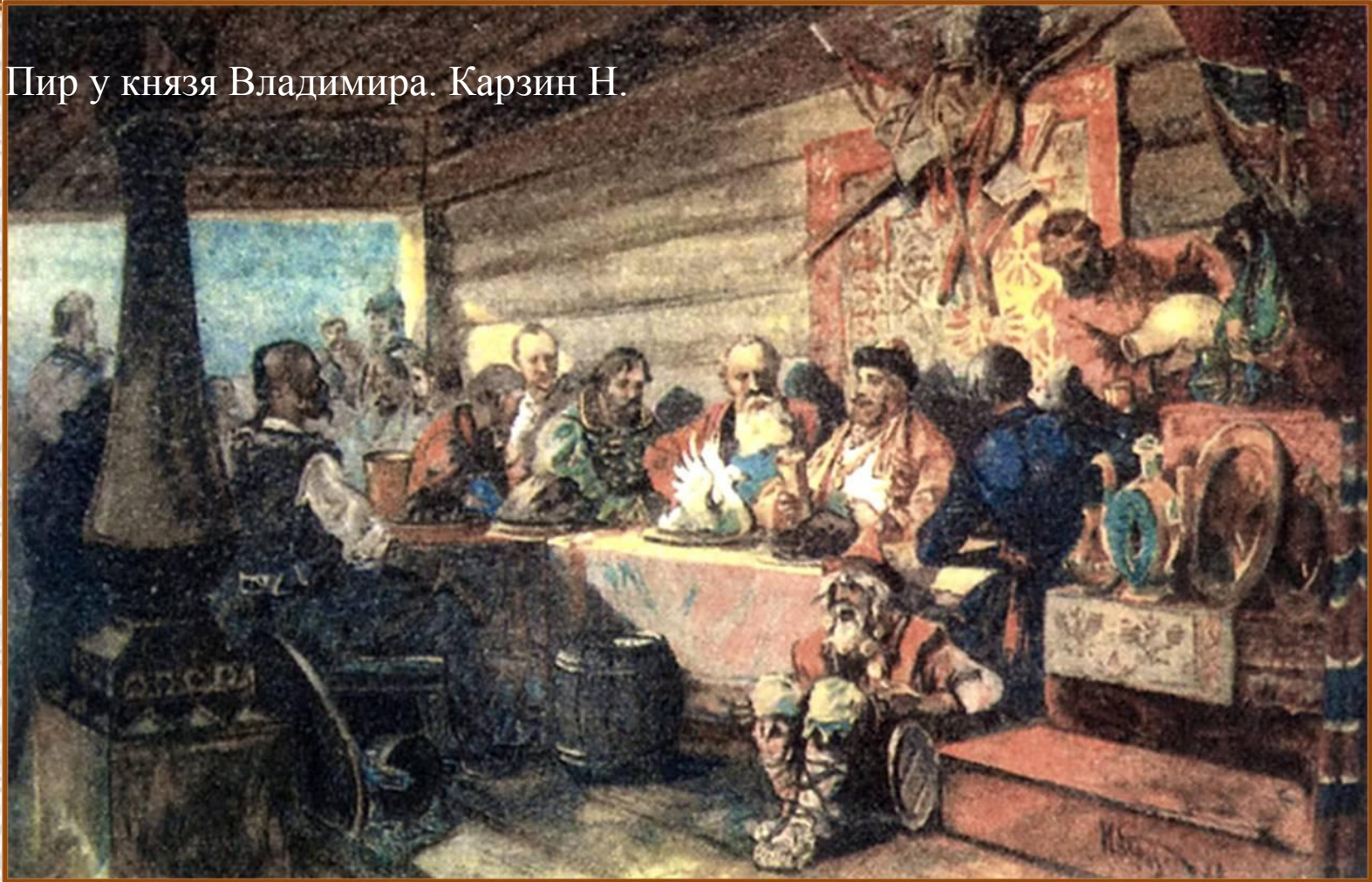
Пир у князя Владимира. Карзин Н.

И, как пишет Нестор-летописец, Владимир созвал бояр и старых мудрых людей городских и рассказал, как к нему приходили проповедники из разных стран. Сказал также о том, как удивил его грек своей проповедью о другом свете, о воскресении людей и о жизни вечной.