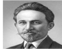
Скобелев М. меньшевик

27 февраля – создан Петроградский Совет рабочих и солдатских депутатов