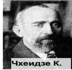
Чхеидзе К. меньшевик