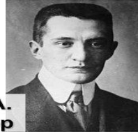
Керенский А. минюст, эсер

СЛОЖИЛОСЬ ДВОЕВЛАСТИЕ- (2 марта – начало июля 1917 года) – система управления, сложившихся в ходе революции и выражающих в одновременном существовании двух противостояния друг другу властей