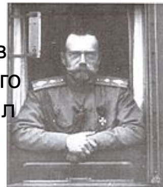
Акт об отречении Императора Николая II. 2 марта 1917 г. (ГА РФ)

2 марта 1917 года император Николай II принял решение отречься от престола в пользу младшего родного брата великого князя Михаила Александровича. Михаил Александрович не рискнул вступить на престол, так как не располагал никакой реальной силой. Монархия пала