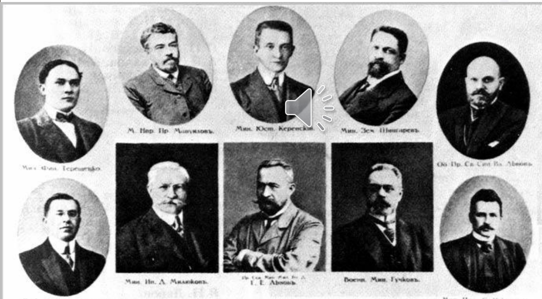
1-ое ВРЕМЕННОЕ ПРАВИТЕЛЬСТВО

1 марта Временный комитет Государственной думы сформировал Временное правительство России. Временным правительством стало называться потому, что в дальнейшем планировалось передать всю полноту власти Учредительному собранию, которое должно было решить вопрос о форме правления. Вместе с тем продолжалось пользоваться огромным влиянием состоящий из солдат и рабочих Петроградский Совет.