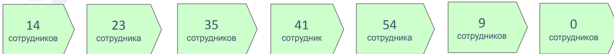
График сокращения текущего персонала