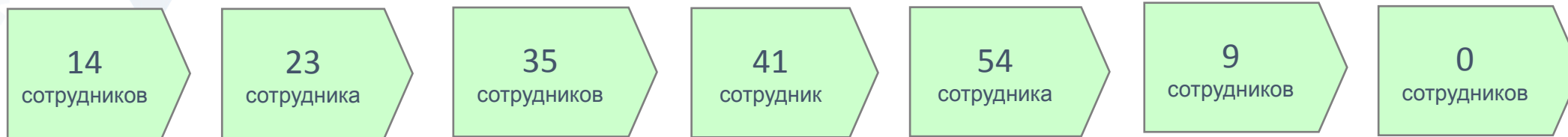
График сокращения текущего персонала