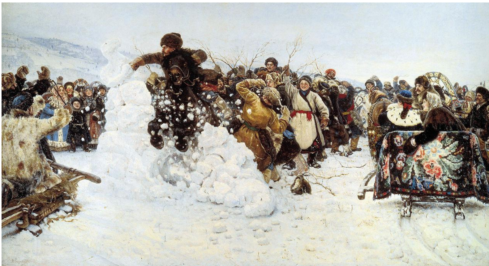
«Взятие снежной крепости» В.И. Суриков