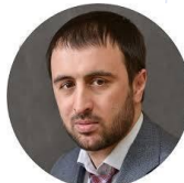
Хуртаев Кантемир Исхакович Председатель "Всероссийского международного союза молодежи"