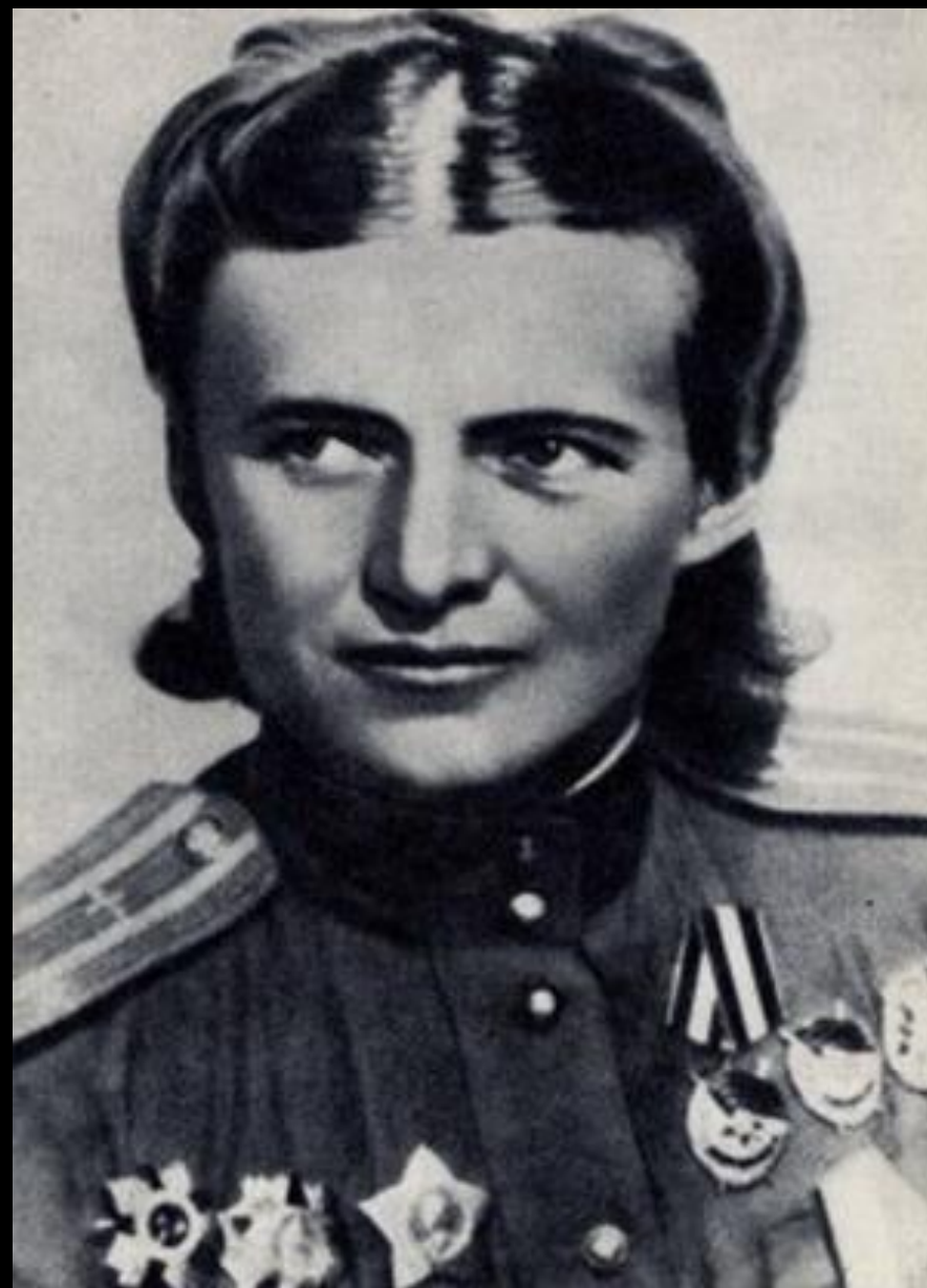
Бершанська Євдокія Давидівна, капітан, гвардії майор, гвардії підполковник (з 02.12.1941 до кінця війни)