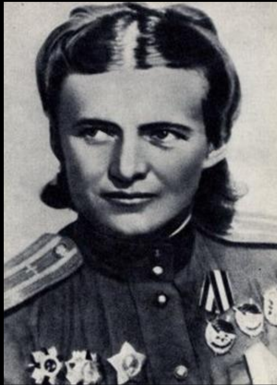
Бершанська Євдокія Давидівна, капітан, гвардії майор, гвардії підполковник (з 02.12.1941 до кінця війни)